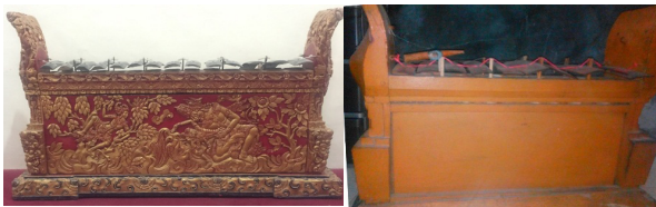
Gamelan yang berisikan ornamen (kiri) Gamelan yang tidak berisi ornamen (kanan)

ar mempunyai fungsi untuk memperindah tampilan dari gamelan tersebut. dengan ditambahkan ornamen tersebut nilai jual maupun keindahan dari bentuk gamelan naik secara finansial maupun secara estetis. Tanpa adanya ornamen tersebut sebuah gamelan terkesan kuno dan tidak mempunyai seni lain kecuali seni gamelan atau kerawitan. Dengan ditambahkan ornamen tersebut menambah nilai seni yaitu seni kriya maupun seni rupa didalamnya sehingga bisa memberikan makna tertentu kepada masyarakat.