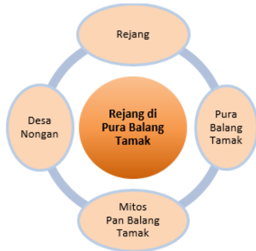
Gambar 1. Diagram keterhubungan antar ide yang membangun Rejang Pala

Sejak tahun 2005 ketika peneliti pertama kali menyaksikan prosesi tersebut, masyarakat Pura Balang Tamak selalu antusias mengisahkan keindahan dan keunikan Rejang mereka. Ada yang menyebutnya sebagai Rejang Balang Tamak, Rejang Renteng, Rejang Buah dan Rejang Pala. Peneliti menangkap kerinduan masyarakat agar Rejang ini dapat hidup kembali. Mereka selalu bersemangat mengisahkan gelungan yang konon dihiasi oleh beragam buah hingga berjuntai-juntai, bahwa dulu sangat mudah mendapatkan pamundut yang masih gadis, dan kisah tentang berbagai reaksi masyarakat luar yang melihat gelungan Rejang tersebut ketika prosesi mengambil air