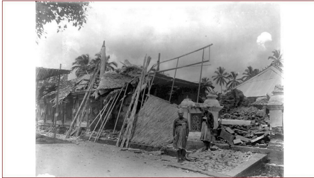
Gambar 4. Gambaran mengenai kondisi Bali ketika peristiwa gejer Bali 1917