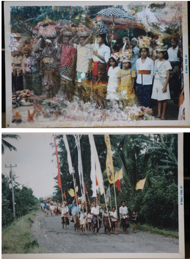
Gambar 2. Foto Rejang Pala pada prosesi Usaba Pala , Februari 1987.