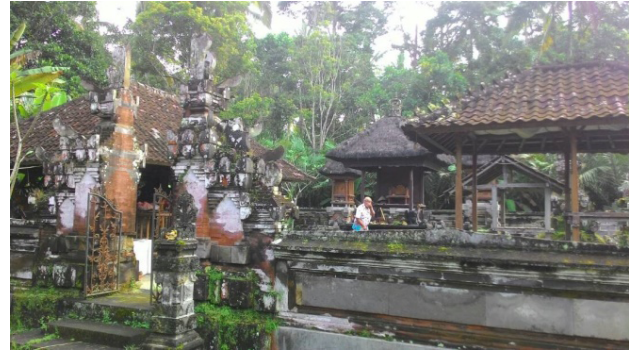
Gambar 5. Kondisi Pura Balang Tamak setelah rekonstruksi tahun 1984

jang di Pura Balang Tamak. Ketika itu Jero Mangku Suweda disebut berusia sekitar 90-an tahun. Melihat sebaran dampak yang diakibatkan oleh peristiwa gejer Bali 1917, serta mengaitkan angka tahun gejer dengan usia Jero Mangku Suweda dan minimnya informasi saat ini, dapat ditarik kesimpulan bahwa Pura Balang Tamak terkena dampak peristiwa gejer Bali 1917 dan tidak segera diperbaiki oleh masyarakat pendukungnya ( penyungsong maupun pengempon ) karena alasan tertentu. Meski demikian, dalam rentang waktu 67 tahun tersebut, masyarakat menunjukkan rasa baktinya dengan tetap menghaturkan upacara sederhana disebut canang sari ( nyanang ) di sisa reruntuhannya.