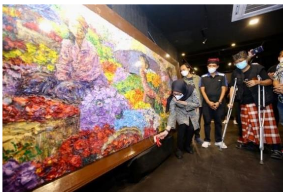
Gambar 3. Dokumentasi pameran tahun 2021

Ini dapat memengaruhi bagaimana karya seni dipandang oleh publik dan memberikan pandangan yang beragam dalam penilaian seni. Habitual juga dapat memengaruhi tingkat partisipasi dan interaksi dalam event pameran seni. Orang dengan habitus yang aktif dalam lingkungan seni mungkin lebih cenderung terlibat dalam kegiatan pameran, seperti mengikuti tur seni, berpartisipasi dalam diskusi atau workshop, atau bahkan menjadi kontributor dalam event tersebut. Hal ini dapat memperkaya pengalaman pameran seni bagi semua peserta.