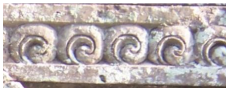
Gambar 7. Motif Hias Keketusan (kakul-kakulan)