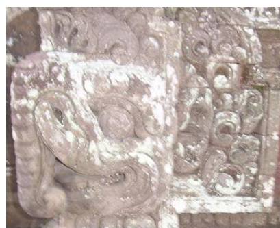
Gambar 2. Motif hias Karang Gajah/hasti kombinasi dengan Patra Punggel