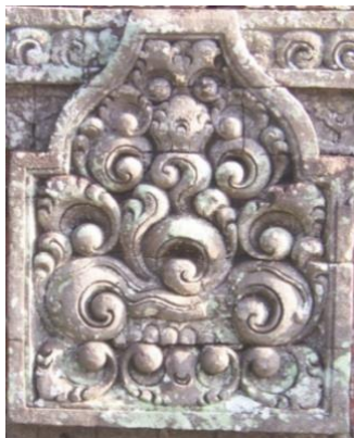
Gambar 5. Motif Hias Karang Bentulu kombinasi dengan Patra Punggel