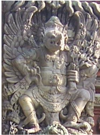
Gambar 6. Motif Hias Garuda