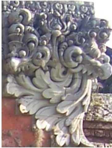
Gambar 3. Motif Hias Karang Guak dan Karang Simbar