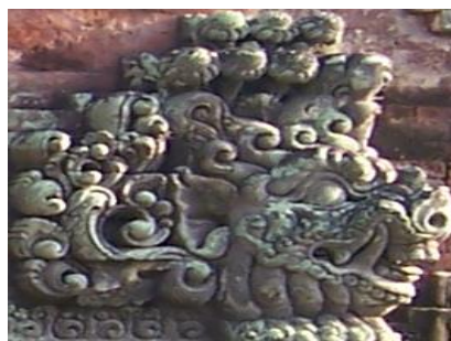
Gambar 4. Motif Hias Karang Babi kombinasi dengan Patra Punggel