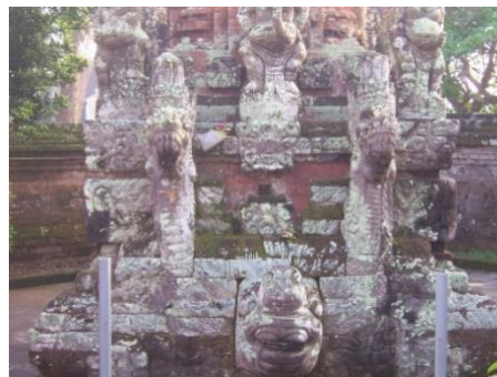
Gambar 1. Motif Hias Bhadawang Nala, Naga Anantabhoga, dan Naga Basuki yang menghiasi bangunan Padmasana di Pura Puseh Desa Adat Batubulan

Wujud karya yang ditampilkan dalam penciptaan ini terdiri dari dua karya berupa hiasan dinding atau karya dua dimensional, Tahap awal dilakukan pembuatan model sesuai dengan sket alternatif yang dipilih sampai menjadi prototype dengan detail-detail yang cermat sehingga pencapaian bentuk fisik maupun unsur estetikanya. Adapun bahan yang digunakan dalam perwujudan ke 2 buah karya tersebut terdiri dari kayu jati, batu permata, dan plat logam tembaga dengan ketebalan 0,8 mm. Untuk logam tembaga perwujudannya dilakukan dengan menerapkan teknik pahat logam seperti teknik kenteng rancangan , wudulan dan terawangan/tembus . Sedangkan pada kayu karena menggunakan limbah kayu jati yang sudah dipilih dan direspon dipahat pada bagian-bagian tertentu tanpa menghilangkan karakter kayu yang sudah ada. Pengaplikasian tiga material yang memiliki sifat-sifat dan karakter yang berbeda ini diharapkan bisa melahirkan karya yang memperlihatkan unsur-unsur kebaruan kreatif dan inovatif. Teknik pahatan dan finishing menjadi dominan pada karya yang diciptakan, karena memadukan berbagai karakter bahan yang berbeda sehingga kelihatan harmonis antara bagian bagian secara keseluruhan