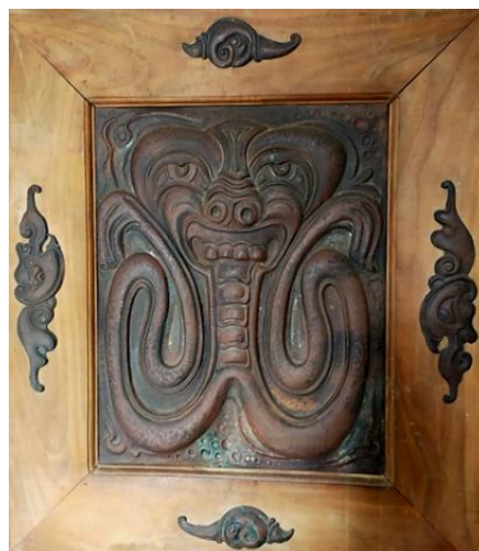
Karya dengan judul : Topeng Sidakarya

Pada bagian alas dari karya ini menggunakan ubalan atau limbah kayu jati yang sudah memiliki karakter unik sehingga bisa direspon menjadi elemen dan bentuk dari senjata nagapasa. Dalam perwujudannya memerlukan keterampilan dan teknik yang baik sehingga bisa mengaplikasikan beberapa karakter bahan yang berbeda yang terdiri dari kayu jati, tataan plat tembaga dan batu permata, sehingga menjadi karya kriya yang unik kreatif dan inovatif.