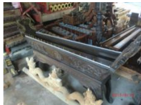
Gambar 6. Model Instrumen Gambang 14 Juni 2015