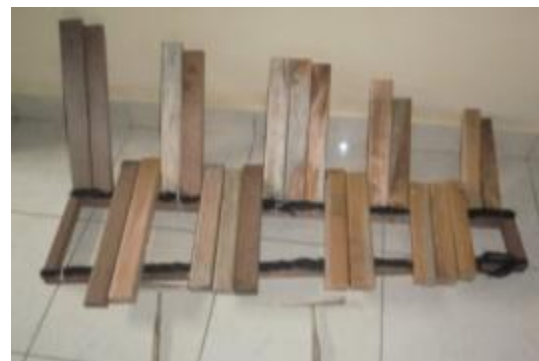
Gambar 3. Interval B Pelag 5 nada tanggal 7 Juni 2015

Berdasarkan percobaan pertama, ditemukan pula ragam laras diatonis, namun