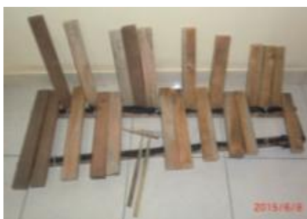
Gambar 4. Interval C Pelog 5 nada tanggal 7 Juni 2015

Setelah berdiskusi dengan Pande Cukrik maka Prototipe gamelan sepuluh nada ini akan mengambil format gamelan-gamelan kuno yang ada di Bali yaitu yang memadukan antara gamelan bahan logam dengan bilah bambu maupun kayu seperti