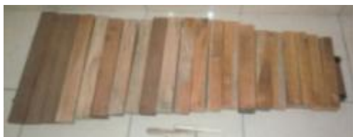
Gambar 1. Petuding Prototipe Gamelan Sistem 10 Nada. Foto: Hendra Mei 2015