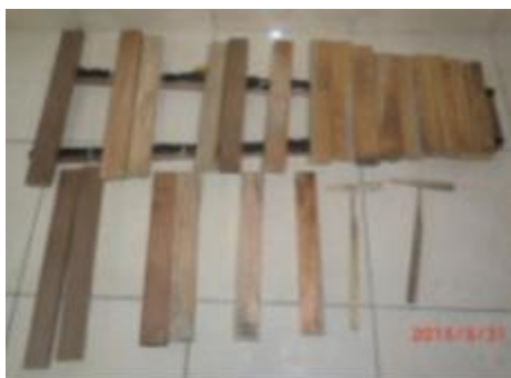
Gambar 2. Interval A Pelag 5 nada tanggal 31 Mei 2015