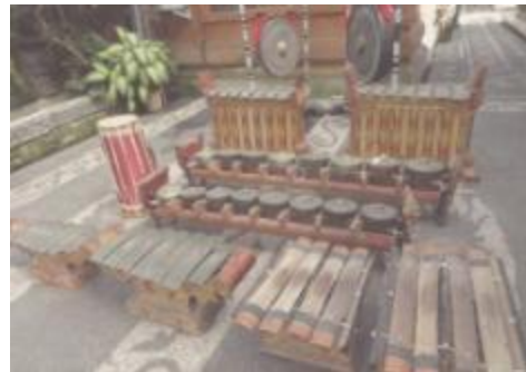
Gambar 5. Gong Luang Banjar Apuan Singapadu