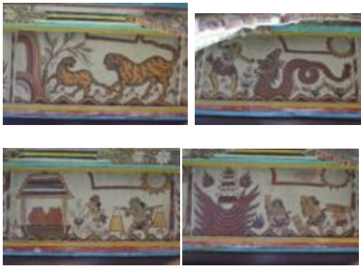
Gambar 1. Beberapa gambar panel-panel ilustrasi Palelintangan pada langit-langit Bale Kambang

Dari pengamatan terhadap gambar palelintangan di langit-langit bale kambang, gambar palelintangan terbagi menjadi tiga bagian yaitu lintang , dewa/wayang dan bagian sato atau binatang. Bagian lintang berjumlah 35 panel, dewa dan sato masing-masing berjumlah 7 panel, sehingga palelintangan di langit-langit bale kambang seluruhnya berjumlah 49 panel.