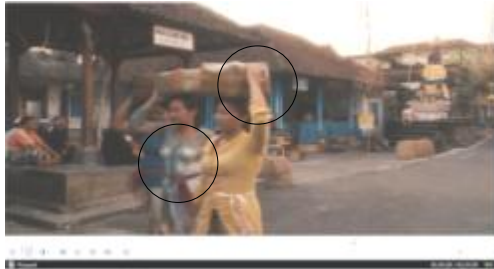
Scene 24. Durasi ke - 01.43.20