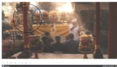
Scene 34. Durasi ke - 01.56.14