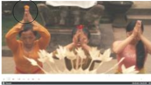
Scene 23. Durasi ke - 01.43.16