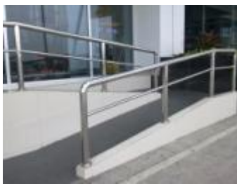
Gambar 1. Akses Ramp

Karlen dalam bukunya menyebutkan bahwa kemiringan maksimal sebuah tanjakan adalah 1:12. Panjang maksimum tanjakan menerus adalah 33 ft (sekitar 915 cm) jika melebihi panjang tersebut, tanjakan harus memiliki area datar untuk istirahat sepanjang minimum 5 ft (sekitar 150 cm). Tanjakan juga harus dilengkapi dengan handrail (Karlen, 2007: 51). Penegasan mengenai beban kerja otot pada ramp dikemukakan Suhardi, dkk (2007) yang menyebutkan bahwa dalam menggerakkan kursi roda, mengangkut maupun mendorong beban, jika ramp memiliki kemiringan < 10^\circ , maka kebutuhan tenaga yang diperlukan masih dalam kondisi aman dan tidak menyebabkan kelelahan otot. Terlebih jika ramp menggunakan satuan standar internasional yang menyebutkan bahwa ramp ideal memiliki sudut kemiringan 7^\circ .