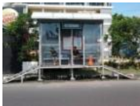
Non- Permanen Type 3