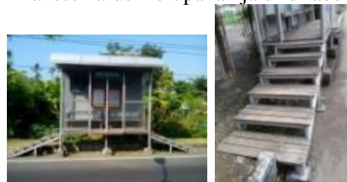
Gambar 9. Halte tanpa ramp .