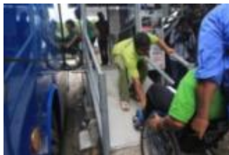
Gambar 5. Akses ramp yang curam

Pada beberapa halte, ramp memiliki derajat kemiringan yang tinggi. Perbandingan antara tinggi ramp dengan panjang ramp hanya berkisar 1:2, yang sangat jauh dari ukuran standar rasio minimal ramp yang baik yaitu 1:12. Kondisi ramp menjadi sangat curam, dan penyandang disabilitas tidak bisa mengakses secara mandiri. Ini bertentangan dengan asas kenyamanan yang dibutuhkan oleh penyandang disabilitas dari aspek kemandirian. Disamping itu keselamatan juga menjadi hal yang diragukan.