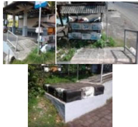
Gambar 6. Ramp yang tidak aksesibel

Ramp tidak dapat diakses dengan baik karena: ada jarak yang tinggi antara jalan dengan ramp , ada halangan berupa rambu lalu lintas, pedagang, parkir, dll.