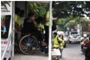
Gambar 11. Ruang gerak yang sempit bagi pengguna kursi roda

Pada beberapa halte terutama yang berjenis non-permanen, lebar ruang sisa yang tersedia hanya 80 cm. Ini akan menyebabkan kesulitan ruang gerak bagi pengguna kursi roda, terlebih jika ada calon penumpang lain yang juga berada dalam halte tersebut. Untuk memutar arah kursi roda 90° setelah naik melalui ramp untuk mengarah pada bukaan menuju bus, akan menemui kesulitan karena terbatasnya haluan yang ada didalam ruang halte. Pelebaran ukuran halte akan lebih memberikan kenyamanan bagi pengguna kursi roda maupun pengguna halte lainnya