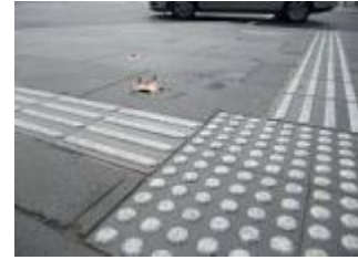
Gambar 2. Guiding block