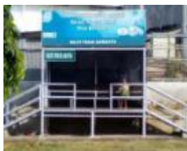
Non- Permanen Type 4