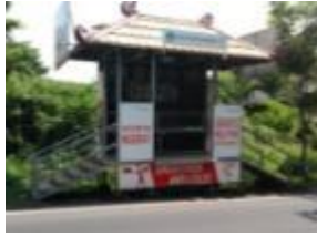
Non- Permanen Type 2