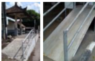
Gambar 8. Handrail halte

Seluruh halte Trans Sarbagita yang memiliki ramp dilengkapi dengan handrail . Ada yang jumlahnya sepasang tiap ramp , namun ada juga yang hanya pada satu bagian sisi ramp saja. Handrail hendaknya dipasang pada dua sisi sekaligus sebagai pembatas dan pengaman pada ramp . Ini akan membantu pengguna kursi roda untuk menarik kursinya dengan seimbang dan dengan tenaga yang lebih kecil. Material handrail pada beberapa halte juga dirasakan tidak nyaman karena terbuat dari besi yang pada saat siang hari dan matahari terik akan terasa panas untuk dipegang, sedangkan pada saat hujan menjadi licin dan dingin. Material handrail bisa diganti dengan material lain yang tidak menyerap panas, bertekstur tidak licin, dan kuat untuk cuaca luar, atau tetap menggunakan besi namun dengan finishing tertentu.