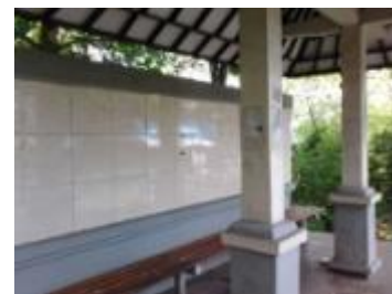
Gambar 3. Jenis Halte Permanen Trans Sarbagita

Halte dengan jenis non-permanen (sementara), struktur konstruksinya tidak mengait langsung kepada pondasi ke tanah atau jalan raya namun hanya menggunakan dudukan beton cor sebagai pijakan tiang-tiang bangunan halte yang mayoritas terbuat dari pipa besi. Untuk landasan atau lantainya terbuat dari plat besi bordes, dudukan kursi dari pipa besi, pipa besi dengan papan kayu, atau atau pipa besi dipadukan dengan plat besi krom. Dinding belakang berupa tiang besi yang dilapisi panel polikarbonat, dengan atap menggunakan genteng metal ( zinc ) atau fiberglass. Halte jenis ini juga terdapat dalam 4 desain yang berbeda. Untuk lebih jelasnya dapat dilihat pada gambar berikut: