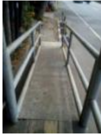
Gambar 7. Lebar ramp yang sempit (75cm).

Ukuran lebar ramp juga memperhatikan jangkauan tangan dari pengguna kursi roda, sebab ukuran lebar ramp juga tergantung pada posisi handrail yang sekaligus menjadi pembatas tepian ramp . Posisi handrail berpengaruh saat pengguna kursi roda menarik kursi. Untuk menentukan posisi tersebut, perlu dilakukan pendataan ukuran persentil antropometri pada sample pengguna kursi roda.