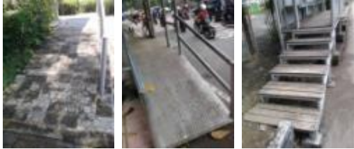
Gambar 10. Ramp tanpa guiding block

mereka tuju. Guiding block dapat dipasang pada bagian awal ramp , bagian tengah sepanjang ramp , dan bagian akhir ramp , sehingga difabel tuna netra dapat mengetahui bahwa jalur yang mereka lalui sudah tepat.