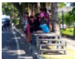
Gambar 4. Jenis Halte Non-Permanen Trans Sarbagita.

Halte koridor I dengan Rute Denpasar Kota-GWK dan sebaliknya berjumlah total 34 unit. Dari jumlah tersebut, 14 unit diantaranya adalah halte berstruktur permanen, dan 20 unit lainnya berstruktur non-permanen. Diantara 20 unit yang berstruktur non-permanen, terdapat halte non-permanen type 1 sebanyak 14 unit dan type 2 sebanyak 6 unit. Halte pada koridor II dengan rute Batubulan-Nusa Dua dan sebaliknya, jumlah totalnya 41 unit dengan rincian 8 unit halte dengan struktur permanen dan 33 unit dengan struktur non-permanen.