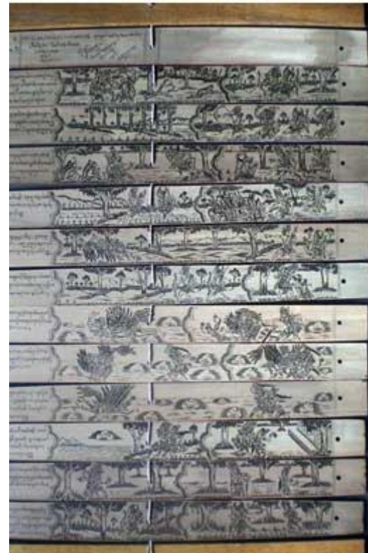
Gambar 2. Prasi Ramayana berjudul Kiskinda

Parwa