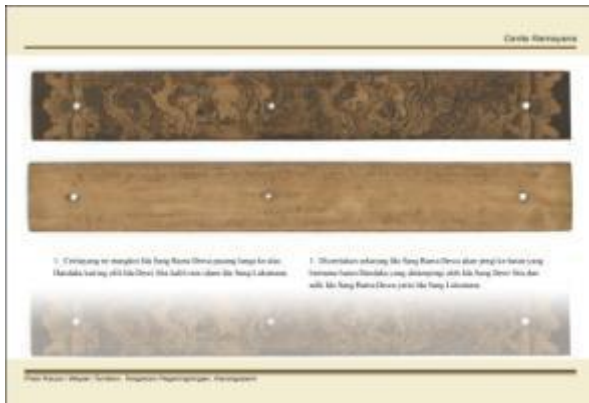
Gambar 6. Hasil prasi dalam bentuk digital.