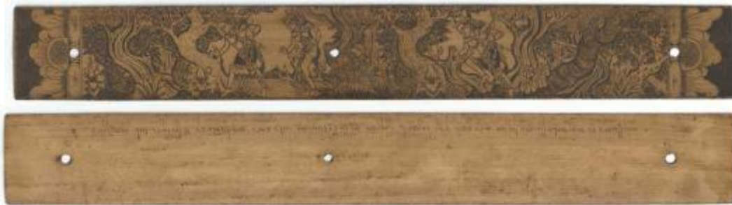
Gambar 1. Gambar Lontar Prasi yang dibuat oleh seniman

Lontar Prasi merupakan salah satu karya seni rupa tradisional masyarakat Hindu Bali, termasuk warisan budaya nenek moyang yang memiliki nilai estetika tinggi dan mempunyai karakteristik tersendiri. Lontar Prasi pada awalnya merupakan suatu media yang disucikan, berkembang memenuhi kebutuhan estetis dan ekonomis bahkan lebih lanjut kegiatannya berkembang menjadi usaha industri seni.