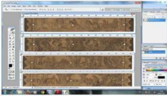
Gambar 5. Proses pemindahan prasi ke dalam digital. (sumber gambar: dokumen pribadi)