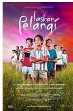
Gambar 2. Film Laskar Pelangi