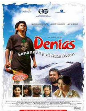
Gambar 1. Film Denias: Senandung di Atas Awan