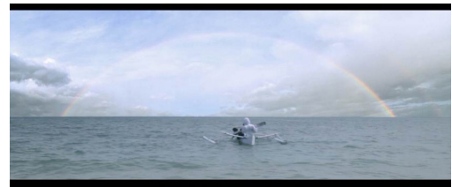
Gambar 7. Lusi kembali mengalami fantasi dan bercengkrama bersama kedua orangtuanya di alam roh.

sutradara yang diwujudkan secara audio-visual berdasar pengalaman empiris yang dialami sutradara dan khalayak secara umum, karena disadari atau tidak fantasi selalu bersanding di dalam kehidupan setiap manusia. Keberhasilan penyutradaraan fiksi fantasi tercapai ketika elemen utama yang digunakan sutradara dalam penggarapan film ini menerapkan konsep ‘fantasi’ – yang merupakan dasar untuk membangun struktur realitas dan menentukan garis bentuk sebuah hasrat ( desire ), sekaligus sebagai sarana jiwa ( psyche ) yang selalu mengikatnya kepada sebuah ‘kenikmatan’ ( jouissance ). Artinya fantasi hidup dan melebur dalam sebuah realitas.