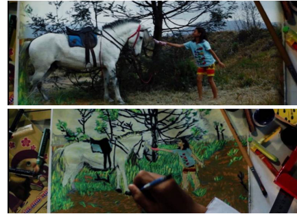
Gambar 2. Alur peralihan ilusi yang dialami Lusi.

Exposition: Permulaan, dijelaskan dengan peran pelukisan dan motif lakon. Sebagai prolog dalam cerita ini, pelukisan diawali dari gambaran kesunyian sebuah pantai yang hanya ada seorang anak sedang asik bermain pasir dan muncul sosok asing tidak dikenal berjubah hitam-putih. Adegan cerita ini merupakan pengenalan tentang seorang gadis kecil bernama Lusi.