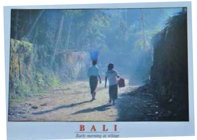
Gbr.2. Kartu pos K Sujana yang didominasi oleh unsur kontras.