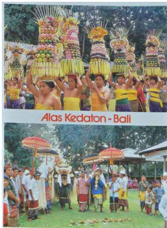
Gbr.5. Kartu pos K Sujana yang didominasi oleh unsur komposisi yang ketat .

5. Komposisi : dalam istilah fotografi, komposisi adalah susunan gambar dalam batasan satu ruang atau frame. Komposisi memiliki fungsi untuk memberi kenyamanan pandangan mata penikmat untuk fokus kedalam sebuah objek tertentu. Demikian juga pada media fotografi, peranan komposisi sangatlah penting dalam meningkatkan tampilan keindahan visual dari karya foto (Soelarko, 1978:1). Dalam komposisinya, angle eye level paling banyak digunakan oleh K Sujana, mengingat angle tersebut memberi kesan netral dan mirip dengan pengelihat manusia normal. Selain itu pola dasar komposisi fotografi yaitu Rule of third banyak digunakan untuk membagi bidang foto agar senantiasa terlihat dinamis dan melegakan.