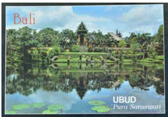
Gbr.4. Kartu pos K Sujana yang didominasi oleh unsur kemurnaan cahaya.

2004 : 25). Maka akan muncul kesan yang nyata pada penampakan gambar, sesuai dengan arah dan intensitas cahayanya. Dalam bidang fotografi, pencahayaan menentukan intensitas besar kecilnya cahaya yang masuk kedalam lensa dan membakar emulsi film pada fotografi analog dan mencitrakan warna pada Charge Couple Device (CCD) atau Complementary-Metal Oxyde Semiconductor (C-MOS) dalam fotografi digital (Kim, 2004:8). Dalam seluruh karya K. Sujana, pertimbangan pencahayaan dilakukannya dengan sangat matang. Bersumber pada cahaya alam dari matahari, Sujana lebih banyak memanfaatkan arah cahaya samping dan cahaya belakang dalam karyanya. Hal itu bertujuan untuk memberi dimensi yang lebih kuat dan tentu saja memunculkan kesan visual yang lebih menarik. Di keseluruhan Karya K Sujana, cahaya matahari terlihat sangat mendominasi dengan posisi cahaya depan dan cahaya samping. Termasuk juga beberapa cahaya belakang dalam foto sunrise dan sunset.