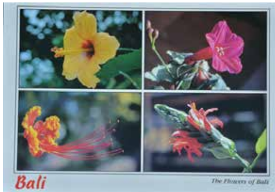
Gbr.6. Kartu pos K Sujana yang didominasi oleh unsur focus of interest yang tegas .

dapat disebut karya seni, fotografi kini telah dapat disejajarkan keberadaan kekayaan estetikanya dengan karya lukis sendiri yang memiliki berbagai sudut pandang makna dan konteks, walaupun masih dalam batasan persepsi visual saja.