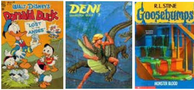
Gambar 5 Komik Donald Duck, Deni Manusia Ikan dan Goosebumps