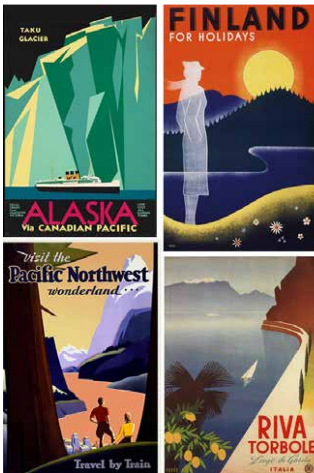
Gambar 6 Postcard bergaya vintage

Ide warna vintage juga terinspirasi dari warna-warna desain postcard bergaya vintage dari berbagai negara yang pernah dilihat pada media sosial, seperti gambar 6. Warna vintage yang digunakan adalah strategi Monez untuk menampilkan nuansa Bali tempo dulu dengan gaya kekinian (postmodern) (Wawancara dengan Monez pada 15 Juni 2017).