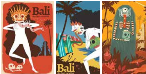
Gambar 1. Visualisasi ketiga seri ilustrasi Rangda karya Monez

Ketiga seri ilustrasi rangda karya Monez di publikasikan secara dalam media poster dan postcard (kartu pos). Keunikan pada ilustrasi ini terletak pada visualisasi rangda yang berbeda dari wujud rangda pada umumnya (secara tradisi). Bentuk mapan rangda secara tradisi dirubah sesuai dengan imajinasi Monez. Tampilan rangda karya Monez juga bertujuan menawarkan originalitas bentuk yang diciptakan dengan mengkombinasi nilai tradisi Bali dan mengemas dengan gaya yang lebih kekinian (Wawancara dengan Monez pada 24 April 2017). Monez dengan idealisnya berusaha menampilkan karakter rangda sesuai dengan gaya khasnya dan berdasarkan dengan ingatan-ingatan atas imej rangda yang pernah di lihat pada masa lalu, sehingga terciptalah 3 seri ilustrasi rangda karya Monez seperti gambar berikut :