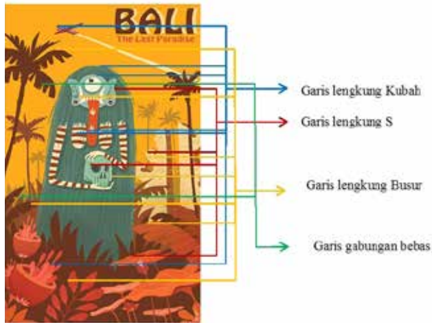
Gambar 3 Karakteristik garis Pada Ilustrasi Rangda Seri 2