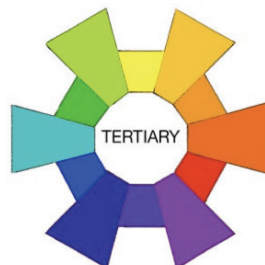
Gambar 3 . Warna Tersier

Campuran 1 warna primer dengan warna sekunder disebelahnya. Warna tersier terdiri dari 6 warna.