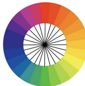
Gambar 4 . Roda Warna

Dari warna primer, sekunder, tersier, terbentuklah roda warna sebagai berikut.