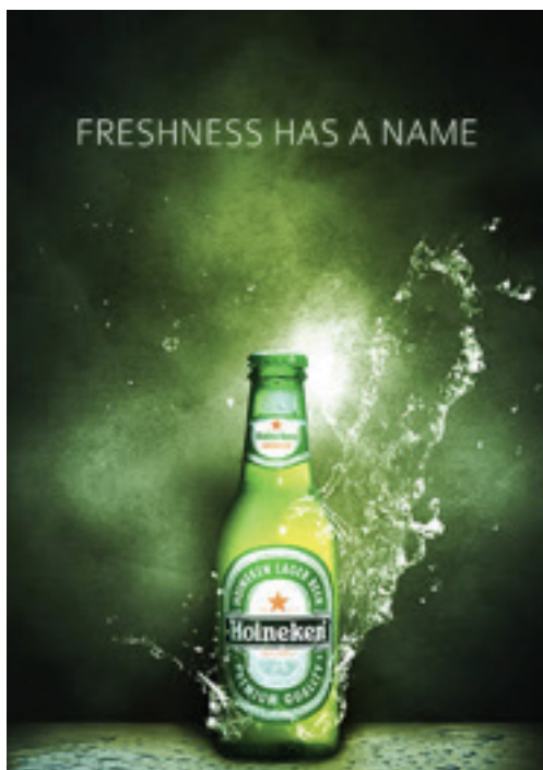
Gambar 5 . Desain poster dari hoineken

Warna merupakan suatu unsur keindahan yang terlepas dari tampilan suatu desain, berikut akan dibahas peranan warna sebagai pembentuk estetika pada media promosi poster dari Hoineken