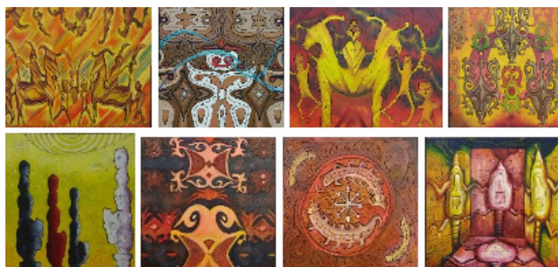
Gambar 3. Karya seni lukis berbasis bentuk-bentuk artefak seni rupa Batak Toba

artefak salah satu etnik di Sumatera Utara, yaitu Batak Toba. Teknis yang dikembangkan, pertama berbasis teknologi digital, dengan memanfaatkan kemajuan revolusi industri 4.0. Kedua, menggunakan media karet sebagai tafril lukisan, dan ketiga menggunakan alat penghantar panas untuk pengolahan tekstur dan citra lukisan.