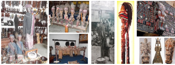
Gambar 1. Beberapa bentuk artefak seni rupa Batak Toba

Keragaman seni rupa Batak masa lalu dapat dikelompokkan pada bentuk-bentuk yang sudah dipahami sebagai karya seni rupa, seperti patung, relief, ukiran, anyaman, tenunan, yang diungkapkan pada material batu, kayu, bambu, logam, tanduk, tanah liat, buah kering, benang/serat, dan sebagainya. Bentuk seni rupa ini terungkap dalam produk-produk tradisi, seperti patung pangulubalang, boneka sigale-gale, relief tunggal panaluan, sahan, pustaha, tenunan ulos, berbagai ragam hias (gorga), dan lainnya. Seni rupa Batak Toba masa lalu (tradisi) ini semuanya tergolong seni tarapan ( applied art ), yang mengandung fungsi pakai dalam aktivitas sosial dan budaya masyarakat.