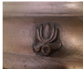
Gambar 9. Simbol padma pada salah satu lonceng Kuil.

Dalam Buddhisme, bunga lotus merupakan simbol dari kemurnian tubuh, ucapan, dan pikiran. Simbol dari nilai agama Buddha tersebut berdasarkan fakta bahwa bunga lotus berkembang indah walaupun tumbuh di atas lumpur yang kotor. Lumpur merupakan simbol dari keterikatan terhadap dunia dan nafsu. Sifat dari bunga lotus yang tidak menyerap air pada permukaan bunganya merupakan simbol dari ajaran Buddha yang melarang pemeluknya terserap ke dalam nafsu duniawi ( www.wikipedia.com , 2019).