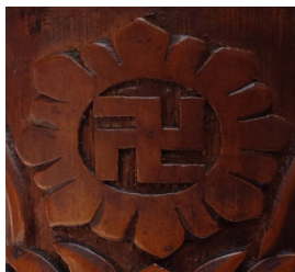
Gambar 8. Mandala mengelilingi simbol Swastika

2. Mandala sebagai representasi keharmonisan yang abadi.