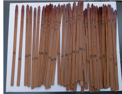
Gambar 3. Qiu Qian di Vihara Buddhi Bandung