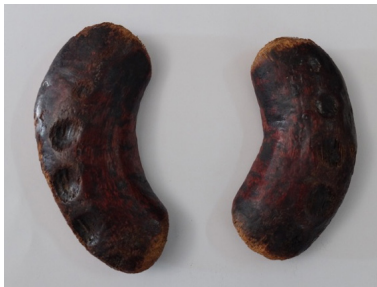
Gambar 2. Jiao Bei/Sinkaw di Vihara Buddhi Bandung