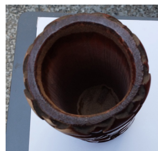
Gambar 6. Qian Tong tampak atas, perbandingan kedalaman objek ukiran mencapai setengah dari bentuk utuh kayu. (sumber: survey, 2019 )

Bentuk dan material pada batang Qiu Qian dibuat berdasar-