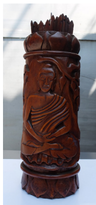
Gambar 5. Qian Tong terisi penuh di Vihara Buddhi Bandung

sinkaw dan melambungnya setinggi 1 meter dan dibiarkan jatuh di lantai. Jika jatuh dalam keadaan tengkurap dan terlentang, maka ramalan yang tertulis di salah satu bambu tadi disetujui oleh dewa. Namun, jika kedua Sinkaw jatuh dalam keadaan tengkurap atau dalam keadaan terbuka, berarti dewa tidak setuju atas Chiamsi yang telah didapatkan tadi. Jika ini terjadi, harus dilakukan pengguncangan ulang. Hal yang sama juga dilakukan pada Sinkaw . Apabila antara Chiamsi dan Sinkaw sudah cocok, maka batang Chiamsi yang diperoleh dicocokkan dengan kertas Chiamsi . Di kertas berukuran 5 cm x 20 cm sudah tertulis terjemahan dari batangan Chiamsi . Apa yang harus kita lakukan, sesuai dengan pertanyaan kita, sudah tertulis di kertas tersebut dan ini bisa dijadikan pedoman bagi pemuja untuk bertidak dalam kehidupan sehari-hari.”