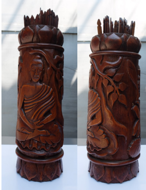
Gambar 7. Sosok Buddha sedang bermeditasi di bawah pohon Boddhi

1. Figur Buddha bermeditasi di bawah pohon Boddhi, representasi kesempurnaan spiritual.