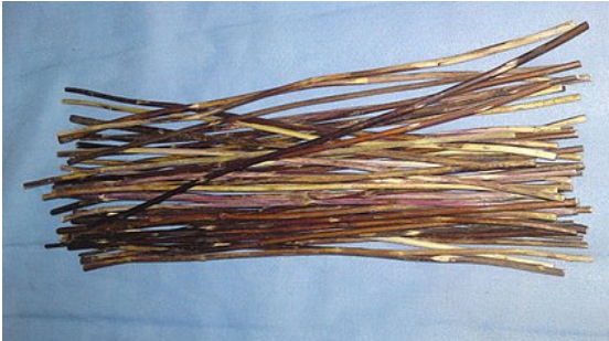
Gambar 1. Batang rumput liar yang dikeringkan yang dikeringkan sebagai Qian (sumber: https://en.wikipedia.org/wiki/I_Ching )