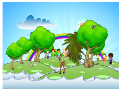
Gambar 6. Bumper Program Dunia Anak TVRI Bali

Warna hijau menjadi warna yang mendominasi pada penataan artistik program Dunia anak. Hijau sendiri memiliki karakteristik warna dingin, dengan makna tumbuhan, natural, lingkungan. Sisi positifnya adalah kesuburan, uang, pertumbuhan, penyembuhan, kesuksesan, natural, harmoni, kejujuran, muda (Luzar, 2011).Warna memiliki pengaruh emosional yang kuat, pengaruh besar terhadap mood, dan mencerminkan ekspresi dari karakter seseorang. Sebagian besar yang terlibat dalam program televisi Dunia Anak adalah anak-anak tingkat dasar, yang mana pada umur ini anak-anak akan sangat mudah terpengaruh emosi atau mood ataupun kreatifitas hanya dengan melihat warna maupun situasi ruangan. Selain warna dingin yang mendominasi tata artistik program Dunia Anak, para penata artistik juga menyisipkan warna hangat sebagai pelengkap, Warna hangat sendiri memberi efek psikologis panas, menggembirakan, menggairahkan dan merangsang (Birren, 1996) Pada pembahasan ini warna hangat disini digunakan sebagai situasi yang menggembirakan, dikarenakan sebagian besar kegiatan dari program ini adalah menghibur dan tentunya menyenangkan bagi anak-anak sebagai pengisi acara.