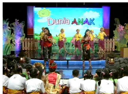
Gambar 2. Segmen 1 Program Dunia Anak TVRI Bali

pengisi acara, Pprogram ini bekerjasama dengan sekolah dan sangar Se-Bali untuk dapat tampil pada setiap episode program Dunia Anak. Produser selaku pemimpin dari program ini harus melalui tahap seleksi untuk pengisi acara, karena pada dasarnya program ini adalah hiburan maka yang harus mengisi program Dunia Anak haruslah pengisi acara yang siap tampil dan tentunya mampu menghibur penonton.