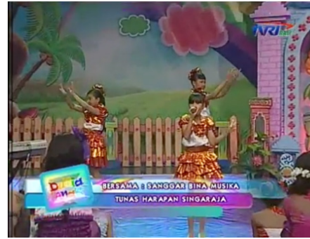
Gambar 4. Tata Artistik Dunia Anak TVRI Bali Sumber : (Vina, 2016) (youtube, diunduh 13 Mei 2019, pukul 14.00 wita)

Pada program Dunia Anak TVRI Bali tidak hanya terdiri dari konsep acara yang sesuai dengan anak, dan pengisi acara yang berbakat, program ini juga didukung oleh penataan artistik yang sangat sesuai dengan anak-anak, mulai dari properti, set dan wardrobe, warna pun menjadi salah satu unsur yang sangat penting karena warna akan mempengaruhi mood anak-anak selama proses rekaman berlangsung. Warna yang dipilih oleh tim tata artistik dominan warna dingin. Pada pembahasan selanjutnya akan diuraikan konsep warna dingin pada program Dunia Anak TVRI Bali serta pengaplikasiannya pada tata artistik program Duna Anak.