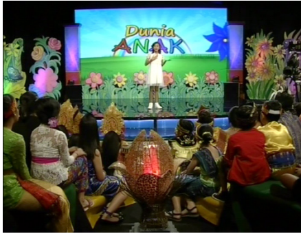
Gambar 3. Segmen 1 Dunia Anak SD Cipta Dharma

trendi, tentunya sesuai dengan umur anak-anak.