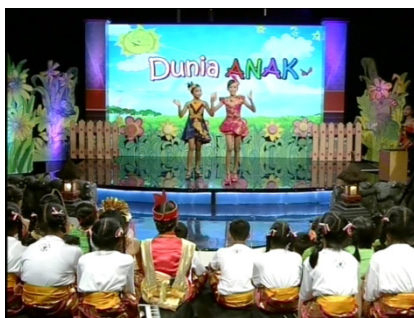
Gambar 1. Segment 1 Menit 2:46 Program Dunia Anak TVRI Bali