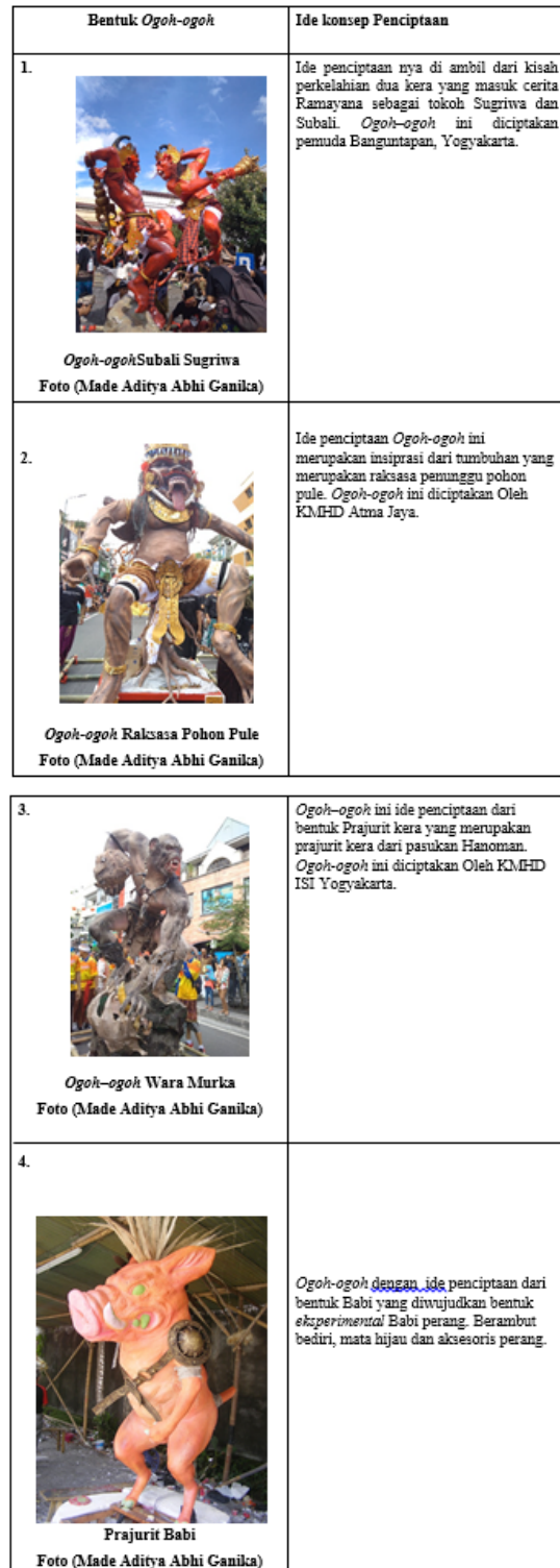
Tabel 1. Bentuk dan konsep penciptaan ogoh-ogoh