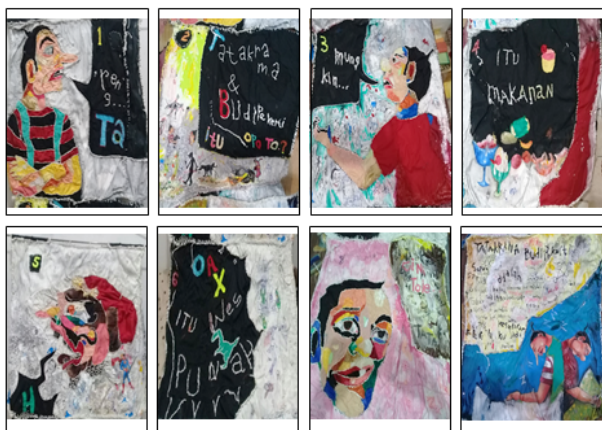
Gambar 1. Komik Kontemporer “Ria Jenaka” Karya Ndaru Ranuhandoko

bagai karakter utama komik. Komik kontemporer ini dibuat dengan menggunakan materi kain, benang, cat tekstil, akrilik, dan pulpen. Komik dibuat dalam 8 panel berukuran vertikal lebih dari dua meter dengan lebar sekitar setengah meter. Bentuknya memanjang dua sisi dan dapat dipasang tergantung di dinding atau dari langit-langit, menampilkan tokoh Petruk, Gareng, Sengkuni, serta Semar. Komik kontemporer berjudul “Ria Jenaka” ini merupakan penciptaan ulang cerita Punakawan yang diinspirasi dari komik Tatang S. dan tayangan Ria Jenaka di TVRI. Berikut tampilan panel-panelnya.