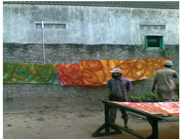
Gambar 4. Proses Pengeringan dan Hasil Bahan yang Sudah Diwarnai

Proses manifestasi penciptaan karya seni ini tidak bisa sekali jadi, melainkan melalui beberapa tahapan proses. Hal ini disebabkan karena adanya beberapa karakteristik yang berbeda dari masing-masing teknik seperti teknik pewarnaan airbrush pada bahan polos dan bermotif serta model atau gambar teknik sesuai rancangan didalamnya termasuk penyelesaian akhir atau finishing . Teknik pewarnaan airbrush ini merupakan seni pewarnaan yang tidak asing lagi dimasyarakat, banyak diaplikasikan pada gambar-gambar anak jalanan serta seni hias tampilan kendaraan, casing ponsel, dan helm. Ketertarikan ini, maka coba diangkat dan diaplikasikan pada fashion dengan mengangkat warna pada tradisi Gorontalo pada unsur permainan warna. Pertimbangan pemilihan motif dan permainan warna pada tradisi Gorontalo yang akan direkayasa selain untuk meningkatkan kualitas