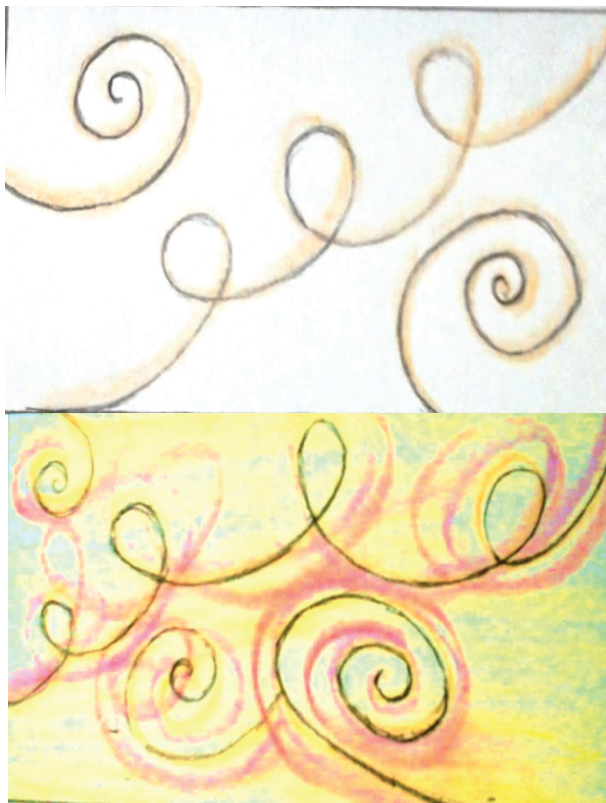
Gambar 2. Desain kerja 1 dan 2