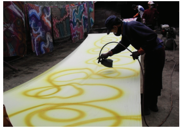
Gambar 3. Proses Pewarnaan