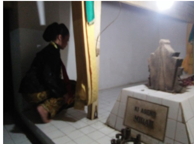
Gambar 5. Peziarah Makam yang melakukan laku dhodhok

Benda ketiga yang kadangkala dibawa oleh peziarah adalah minyak Serimpi atau Pambo. Minyak ini berfungsi