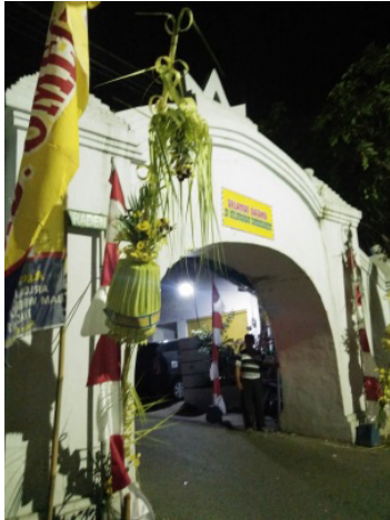
Gambar 1. Gerbang Pertama Makam Bathara Katong

selama semalam di depan makam Bathara Katong. Pada siang harinya Pusaka diserahkan kembali kepada Bupati Ponorogo oleh Juru Kunci Makam. Selain itu, tradisi ziarah makam Bathara Katong secara bersama-sama juga dilakukan pada tanggal 11 Agustus. Masyarakat Ponorogo percaya bahwa pada tanggal ini Bathara Katong secara resmi dilantik menjadi Adipati Ponorogo yang pertama. Sehingga bisa dikatakan bahwa tanggal 11 Agustus merupakan hari jadi Kabupaten Ponorogo.