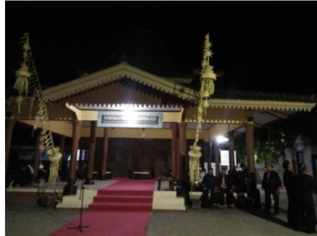
Gambar 2. Pendapa Makam Bathara Katong

Bathara Katong sendiri dulunya hidup ditengah-tengah masa transisi antara kebudayaan lama dan baru, sehingga bangunan-bangunan peninggalan pemerintahannya mengandung kepaduan antara dua kebudayaan, tak terkecuali makamnya. Akulturasi budaya pada tradisi ziarah makam Bathara Katong sendiri dapat ditemukan pada bangunan-bangunan yang ada di area makam Bathara Katong, pada benda-benda yang dibawa oleh peziarah, pada proses