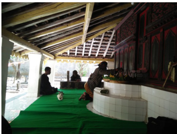
Gambar 6. Peziarah sedang membakar dimik

balik gerbang kelima merupakan kompleks makam Sentono Dalem Kabupaten Ponorogo. Perempuan yang berhalangan dipersilahkan istirahat di depan pintu gerbang kelima. Tepatnya di pendapa Bathara Katong, selain itu di sini juga terdapat bangunan Masjid Jami' Bathara Katong. Proses tradisi selanjutnya adalah berjalan sampai ke bangunan utama makam Bathara Katong. Pada bangunan utama ini kadangkala peziarah makam melakukan proses laku dhodhok .