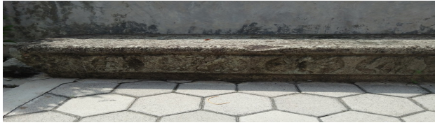
Gambar 3. Prasasti di Makam Bathara Katong (Dok. Amirul, 2017)

Bangunan kedua yang dapat ditemukan adalah Pendapa Makam. Pendapa ini terletak di depan gerbang/gapura makam yang kelima. Pada hari-hari biasa, pendapa ini digunakan sebagai tempat singgah peziarah sebelum memasuki area makam yang lebih dalam. Saat tanggal 1 Sura , keadaannya akan berbeda. Pendapa akan didekorasi sedemikian rupa, kemudian digunakan oleh Bupati sebagai tempat singgah sementara sebelum upacara penerimaan kembali Pusaka Kabupaten Ponorogo. Bangunan pendapa ini berbentuk Joglo terbuka. Arsitektur pendapa yang merupakan ciri khas kebudayaan masyarakat Jawa masih digunakan disini.