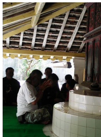
Gambar 7. Peziarah yang sedang berdoa

Kesenian yang berkembang di area sekitar makam adalah kesenian hadroh kontemporer. Hadroh yang diracik sede-