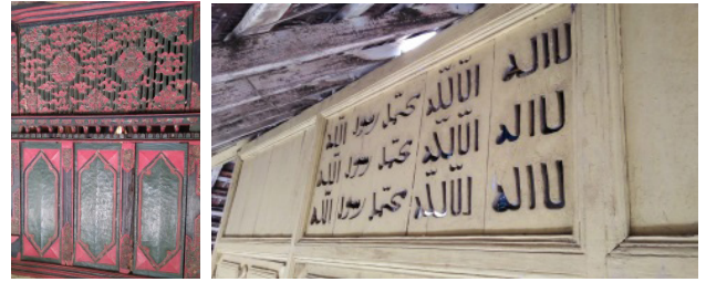
Gambar 3. Ukiran dinding Makam Bathara Katong

Corak ukiran di dinding makam Bathara Katong bagian atas merupakan corak bunga teratai. Corak bunga teratai