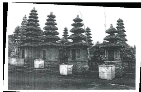
Gambar 2. Pelinggih lama (Sumber : Dokumen panitia Pemugaran 2011).