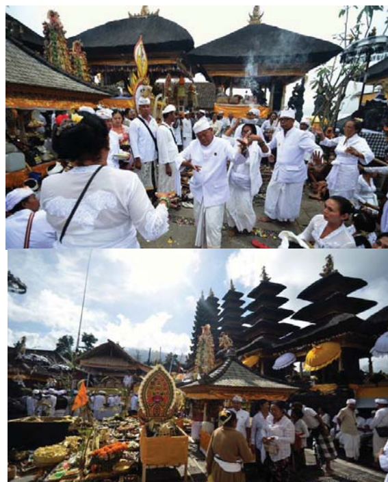
Gambar 3. Prosesi menjalankan kelengkapan upacara dan prosesi Tawur Agung Balik Sumpah.

Dari jadwal Karya Agung tersebut, prosesi upacara karya merupakan satu kesatuan yang tidak dapat dipisahkan satu dengan yang lain, namun kalau dikelompokkan dapat dipilah menjadi tiga. Tahap prosesi awal, yaitu kegiatan nomor 1,2,3,4 (lihat Jadwal), Tahap prosesi tengah atau puncak karya yaitu kegiatan dari nomor 5 s.d nomor 23, dan tahap prosesi akhir, yaitu kegiatan nomor 24 dan 25. Sebagai bukti riil dari tahapan prosesi karya tersebut dapat dilihat pada dokumen berupa photo sebagai berikut.