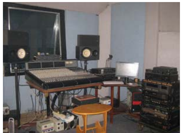
Gambar 7. Ruang kontrol/ ruang Mixing, Editing, dan Mastering Jack's One Studio

Studio Jack's One studio memiliki ruangan tunggu dan sekaligus ruangan kantor yang berada di belakang studio. Ruangan ini berfungsi untuk melaksanakan semua administrasi dan sekaligus juga sebagai ruang tamu yang dilengkapi dengan perlengkapan penunjang untuk memantau ke dua ruangan lain, ruangan tersebut disediakan agar dapat memantau proses selama latihan maupun rekaman.