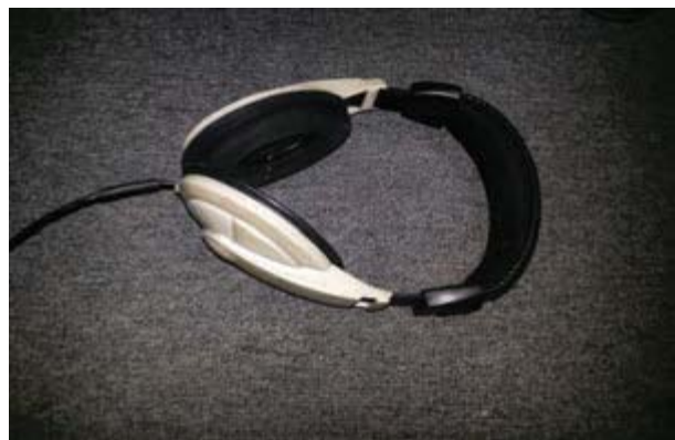
Gambar 5. Headphone merk Samson yang digunakan di Jack's One Studio

Headphone berfungsi untuk memonitor hasil recording . Alat ini sangat berguna misalnya saat kita ingin take suara instrumen, sambil mendengarkan panduan pola musik yang sudah diaransemen. Dengan menggunakan headphone , musik akan terdengar lebih fokus. Jack's One studio memiliki headphone merk Samson dengan kualitas baik pada saat take vokal. Suara yang dihasilkan headphone tersebut setereo (seperti pada gambar 5).