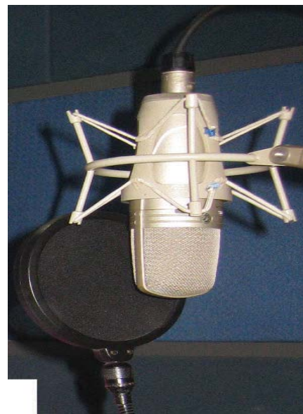
Gambar 2. Input Media yang di gunakan Jack's One Studio merk Shure Microphone (Sumber foto: Junita Batubara 2015)

Microphone adalah suatu alat yang berfungsi untuk mengubah energi-energi akustik (gelombang suara) menjadi sinyal listrik. Microphone sering digunakan di tempat-tempat seperti radio, studio rekaman dan lain sebagainya. Di studio rekaman mikrophone berfungsi sebagai penangkap suara vokal maupun instrumen yang akan direkam. Kualitas dari microphone yang digunakan dalam rekaman menjadi salah satu penentu hasil rekaman. Jack's One Studio memakai microphone jenis kondensor merk Shure (seperti pada gambar 2).