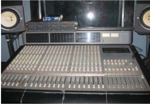
Gambar 3. Input Media (M-audio controller) yang berfungsi sebagai pengatur line instrumen musik.

dan diatur kemudian dikuatkan oleh penguat akhir atau power amplifier. Pada umumnya ada beberapa menu yang terdapat pada mixer controller yaitu: gain , equalizer pada channel , dan swepable equalizer . Jack's One studio memakai input media (M-audio controller) merk Tascam dan memiliki 24 channel routing out put (seperti pada gambar 3).