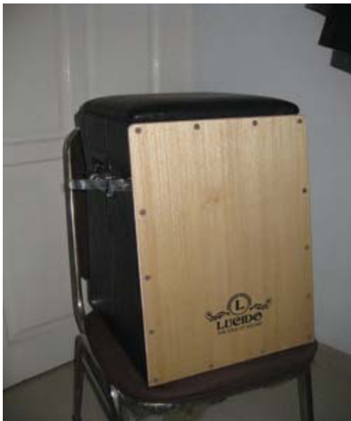
Gambar 10. Instrumen musik Cazon yang dimainkan dalam proses recording lagu O Tao Toba dan Pulo Samosir .

Instrumen gitar akustik (dapat dilihat dalam gambar 11) dalam recording musik O Tao Toba dan Pulo Samosir adalah sebagai pembawa akord . Begitu juga dengan alat musik gitar elektrik adalah sebagai ‘mempertebal’ suara akord sehingga aransemen musik pada lagu O tao Toba dan Pulo Samosir kedengaran seperti musik modern tetapi tetap menggambarkan suasana disekitaran pinggir Danau Toba.