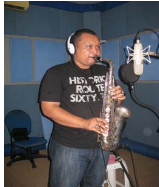
Gambar 6. Ruang Tracking/Take/Rekaman Jack's One Studio

Ruang kontrol/ ruang Mixing, Editing, dan Mastering (dapat dilihat pada gambar 7), merupakan ruangan untuk melakukan pengoperasian (mengontrol) sistem kerja alat-alat untuk rekaman baik secara track maupun live . Ruang ini membutuhkan standar ruang akustik. Tanpa ruang kedap suara kemungkinan proses rekaman menjadi panjang karena banyak suara yang bocor atau pun mengganggu masuk ke dalam rekaman dan merusak sebuah musik (lagu). Ruangan tersebut memerlukan penanganan akustik yang berbeda karena ruangan tersebut harus dapat mendukung tiap frekwensi suara yang bermacam-macam dari alat-alat musik yang terlibat dalam proses rekaman.