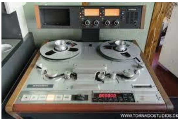
Gambar 1. Multitrack Recording

Pada tahun 1940-an dimulai eksperimen dengan menggunakan multitrack recording (seperti gambar 1) yang terus berkembang menjadi lebih rumit hingga tahun 1960-an. Dengan adanya multitrack recording , teknik merekam dengan memisahkan grup artis dapat dilakukan. Efek lain yang ditimbulkan oleh multitrack recording ini adalah munculnya suara stereo . Pada tahun 1930-an mulai bereksperimen dengan merekam menggunakan dua microphone , dua amplifier , dan dua speaker yang menyebabkan efek aural yang menyenangkan (Pratiwie, 2009: 1).