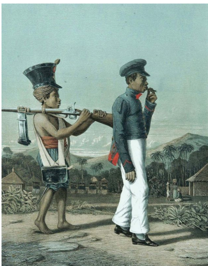
Gambar 1. Serdadu Pribumi karya lithografi van Pers

Dengan semangat orientalistik mengolok-olok dan menghina kaum inlander, para perupa kulit putih lebih mengeksploitasi perbedaan genetik seperti warna kulit kaum inlander yang berwarna gelap, proporsi dan anatomi tubuh yang lebih kerdil, struktur tulang dahi ( osfrontale ) yang lebih menonjol dengan hidung pesek mendekati bentuk phitecanthropus erectus homo soloensis (lebih mirip kera daripada manusia). Dibandingkan dengan obyek-obyek kaum tuan kulit putih yang secara proporsi lebih jangkung, hidung mancung, dengan kulit putih, maka kehadiran kaum pribumi dengan segala kekurangannya secara genetiknya lebih memojokkan posisi pribumi secara kultural sebagai "yang lain" ( the other ) dengan segala kerendahan derajatnya (sesuai asas politik apartheid vreemde oosterlingen pemerintah kolonial).