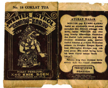
Gambar 3. Kemasan pewarna kain wenter Cap Kumbokarno

Pribumisasi desain untuk kepentingan komersial juga memanfaatkan tokoh-tokoh dunia pewayangan sebagai identitas komersial suatu produk ( brandname atau trade mark ) seperti misalnya obat pewarna. Cap Kumbokarno, teh cap Pandawa Lima, permen mental cap Semar, rokok cap Gareng, wenter atau pewarna kain cap Djanoko Manah dan masih banyak lagi.