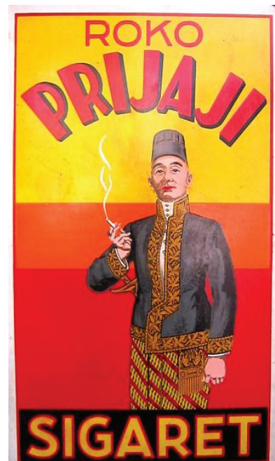
Gambar 4. Iklan enamel rokok Prijaji dimuat majalah Laras Mei 2000

Terlepas dari segala tafsir sosiokulturalnya, karya iklan rokok cap Prijaji ini telah mampu meninggalkan jejaknya sebagai suatu masterpiece dalam kreativitas perancangan dunia desain grafis dan komunikasi visual yang berkembang di Indonesia masa lalu (Hindia Belanda), dan mendapatkan predikatnya sebagai bentuk gaya desain grafis yang khas Indonesia.