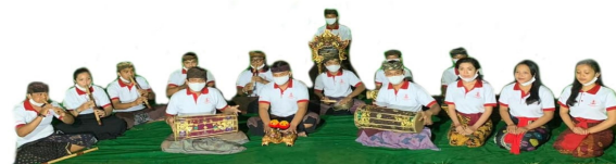
Gambar 4. Setting instrumen dan penabuh batel dari timur (Dokumen Mangku Kt. Garwa 2020)

Konsep tata penyajian ruang/ setting alat gamelan didesain dalam empat tempat berundag/trap dari empat arah mata angin. Di tengah dibuat sebuah titik sentral dengan stage berbentuk lingkaran. Ruang catus pata diimajinasikan dalam ruang terbuka yang ditata khusus untuk presentasi KMK Ngider Bhuwana seperti di bawah ini: