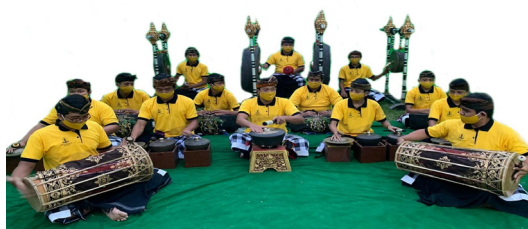
Gambar 6. Setting instrumen dan penabuh balaganjur kolaborasi dari barat (Dokumen Mangku Kt. Garwa 2020)