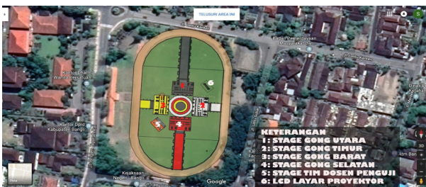
Gambar 2. Lokasi lapangan Kapten Mudita Bangli dengan rancangan stage gamelan dari empat arah dan tengah serta penempatan dosen penguji dan layar Liquid Crystal Display atau LCD proyektor. (Gambar: Trisna Gamana)