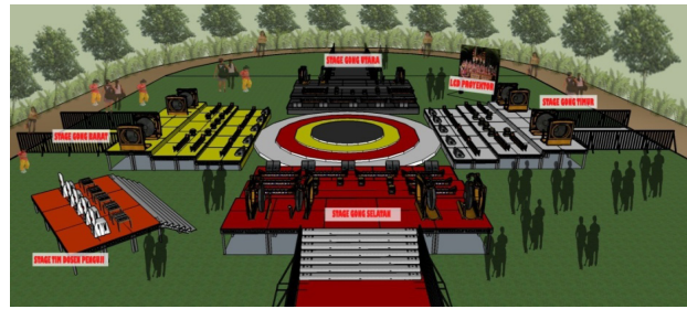
Gambar 3. Stage Penyajian Karya

Konsep lain juga penata penggunaan dalam Agama Hindu untuk memberikan pengayaan terhadap makna dan nilai dari sebuah penggarapan karya. Konsep tersebut adalah teologi Hindu yaitu kata darsana yang merupakan realisasi diri ke dalam Tuhan atau ilmu yang mempelajari segala sesuatu secara mendalam mengenai Ketuhanan, alam semesta, dan manusia. Teologi adalah teori atau studi tentang Tuhan yang dalam bahasa sansekerta disebut Brahma-vidya yang berarti ilmu atau pengetahuan tentang Tuhan (Bakri dalam Donder, 2005:23). Teologi Hindu lainnya yang juga dipergunakan dalam konsep musikal yaitu Saguna Brahma telah terkena sifat, atau dapat dibayangkan sebagai sesuatu yang memiliki wujud tertentu. Tuhan hanya mungkin dapat dihayati dalam konsep Saguna Brahma . Paham Saguna Brahma ini berbagai atribut atau simbol suci dihadirkan untuk meneguhkan keyakinan. Jadi disamping hal tersebut dalam teologi Saguna Brahma , Tuhan juga termasuk memiliki nama, wujud, sifat dan warna.