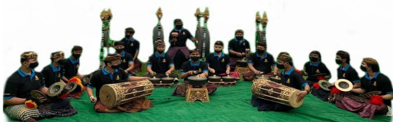
Gambar 7. Setting instrumen dan penabuh bebonangan dari utara

Dalam visualisasinya, barungan gamelan yang ditempatkan di empat arah mata angin dan di tengah tentu dapat melahirkan atmosfer/suasana baru. Sebagai penguat garapan akan dilakukan beberapa kiat yang disebut sebagai trend baru seperti: penggabungan instrumen dari beberapa perangkat gamelan, penambahan instrumen lain, atau memfokuskannya pada penggunaan instrumen sejenis seperti: bilah, pencon dan cymbal (Sugiarta, 2012: 35).