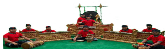
Gambar 5. Setting instrumen dan penabuh bebarungan dari selatan