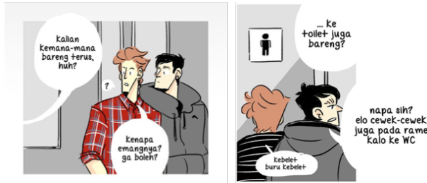
Gambar 1. Panoptikon Muncul Melalui Pembicaraan (Gossip) yang dilakukan Masyarakat