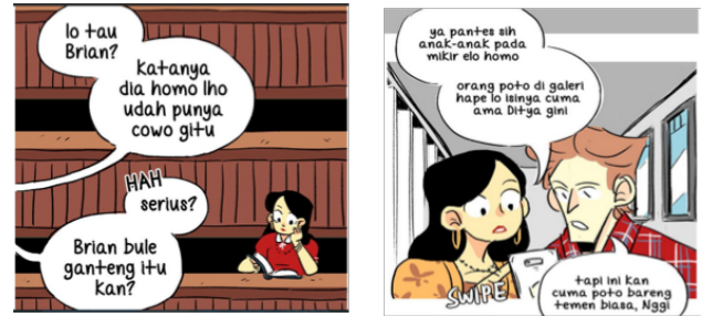
Gambar 2. Angapan Homo yang Tersebar di Masyarakat

rat badan kecil, berpayudara besar, dan lain-lain. Selain itu, menurut Bartky perempuan diawasi terus menerus untuk menjaga bahasa tubuhnya dibandingkan laki-laki. Terdapat berbagai larangan yang harus dipatuhi perempuan misalnya aturan mengenai cara berjalan, berbicara, ataupun yang lainnya. Jika para perempuan tidak memenuhi wacana ideal ini, perempuan tersebut akan dikategorikan bukan sebagai perempuan ideal tetapi digolongkan sebagai sosok yang liyan .