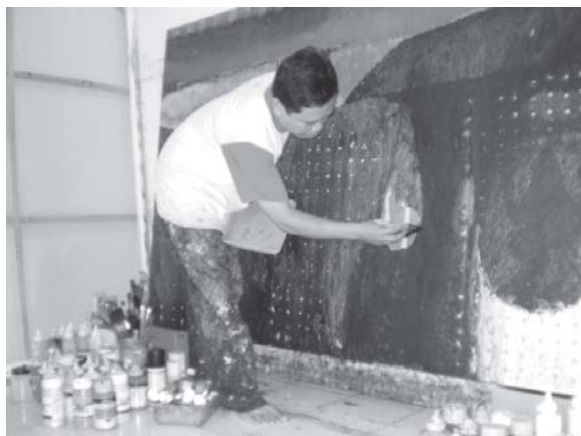
Gambar. 2. Proses melukis membuat bentuk-bentuk detail.