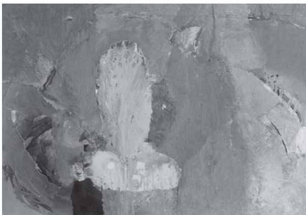
Gambar. 3. Lingga di Pusaran Bumi , 2009, akrilik pada kanvas, 160 x 200 cm.