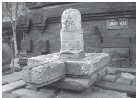
Gambar 1. Lingga-Yoni di Pura Tirta Empul, Tampak Siring, Gianyar.

Wujud karya yang saya ciptakan memiliki kecenderungan abstrak figuratif supaya bisa menyelipkan/menampilkan unsur-unsur simbolisme