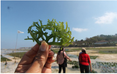
Gambar 2. Salah satu jenis rumput laut.