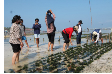
Gambar 4. Membentangkan ( mentang ) bibit rumput laut pada lahan