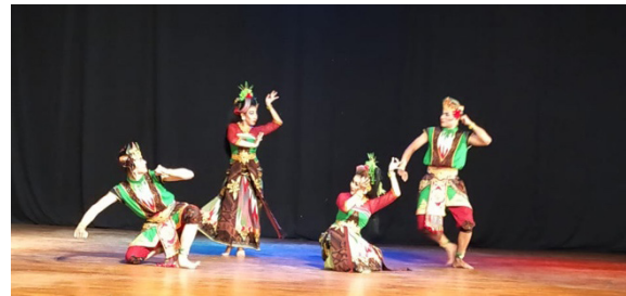
Gambar 15. Penggambaran kegembiraan petani rumput laut, saat selesai memanen dan kembali pulang.

secara bergantian, dan gerakan tangan bergerak seperti gerakan ombak yang ada di laut.