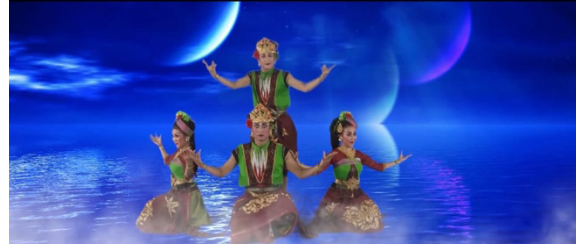
Gambar 14. Penggambaran beberapa gerak memanen hasil rumput laut.