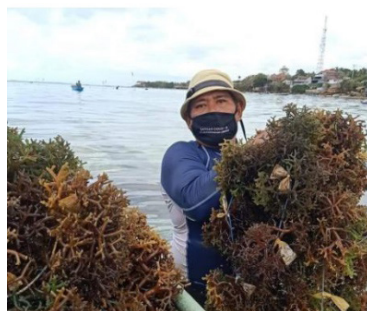
Gambar 6. Memanen rumput laut