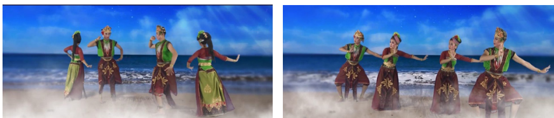
Gambar 12. Penggambaran petani rumput laut yang bersiap-siap untuk bekerja.