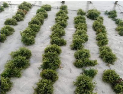
Gambar 5. Bibit rumput laut setelah dibentangkan beberapa hari dan siap dipanen.