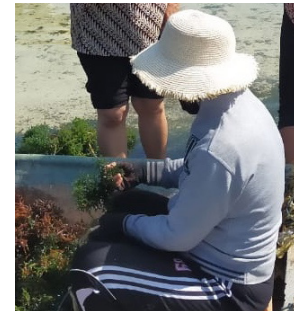
Gambar 7. Ngepik (memetik).