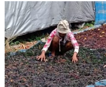
Gambar 10. Nyemuh (menjemur).