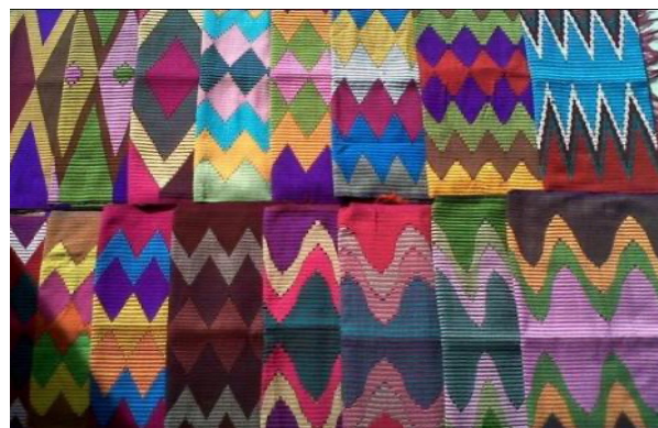
Gambar 11. Motif kain Rangrang khas Nusa Penida.