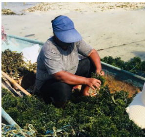
Gambar 8. Ngeles tali (membuka ikatan).