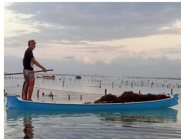
Gambar 9. Membawa hasil panen dengan perahu.