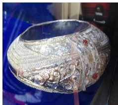
Gambar 2. Galang gadang