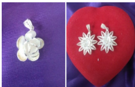
Gambar 6. Liontin bentuk bunga rose dan bunga melati

tetapi peniruan tersebut tidak harus realis-naturalis, melainkan dapat berupa bentuk yang mengalami distorsi, deformasi, bahkan abstraksi. Dengan kata lain bentuk alam pada kerajinan perak tidak sepenuhnya salinan alam secara murni, walaupun unsur seperti daun, bunga, maupun benda lainnya, jelas akan membawa asosiasi kepada alam nyata. Unsur keindahan seni kerajinan perak terlihat dari bentuk visual yang ditampilkan, tetapi terdapat nilai-nilai di balik bentuk visual tersebut. Perajin perak Koto Gadang dalam menciptakan berbagai macam bentuk produk selalu mengambil dari bentuk alam dan bentuk local genius , terkait dengan makna kehidupan yang bersumber dari falsafah “ adat basandi syarak, syarak basandi kitabullah ” sebagai dasar falsafah hidup masyarakat Koto Gadang. Warna yang terdapat pada kerajinan perak koto gadang adalah warna perak yang berbentuk putih susu.