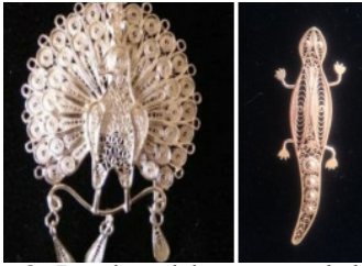
Gambar 8. Bros bentuk burung merak dan cicak