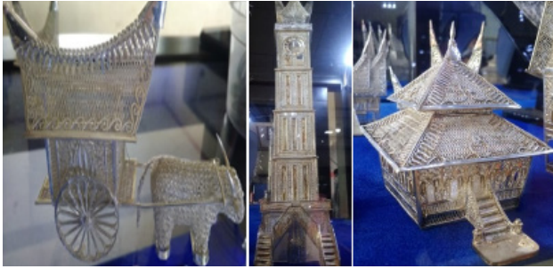
Gambar 4. Produk cenderamata berupa miniature jam gadang, bendi dan mushala