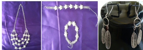
Gambar 3. kaluang, gelang, anting dan bros