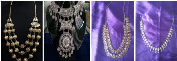
Gambar 1. Kaluang pengantin Koto Gadang