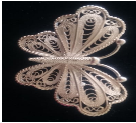
Gambar 9. Bros bentuk kupu-kupu motif daun cubadak dan relung

dari motif yang berunsur tradisi dan motif moderen yang mengalami proses kreatif dari tangan-tangan perajin/seniman. Motif gabungan ini merupakan motif yang dibuat berdasarkan pesan dari konsumen atau selera pasar. Berdasarkan penjelasan di atas dapat disimpulkan bahwa kerajinan perak Koto Gadang cenderung bergaya kedaerahan dan berdasarkan pesanan/ permintaan konsumen.