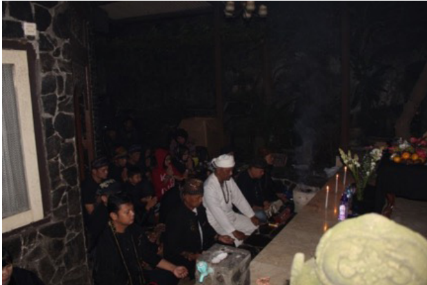
Gambar 2. Upacara Adat Purnamasari