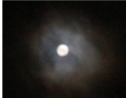
Gambar 3. Kondisi bulan purnama penuh

Upacara ini secara garis besar memiliki dua prinsip yang menjadi alasan mengapa upacara ini harus dilaksanakan, pertama mensyukuri atas nikmat yang telah diberikan Allah Swt kepada setiap umatnya. Prinsip Kedua yaitu berdoa agar nikmat yang telah diberikan mendapat keberkahan dari Sang Maha Pencipta. Berdasarkan dua prinsip tersebut bersyukur dan berdoa merupakan suatu bentuk kegiatan ibadah/bakti yang sudah selayaknya dilakukan manusia sebagai makhluk Sang Khalik. Bakti disini merupakan aktivitas ucap, tekad, lampah yang dilaksanakan dengan baik maka hasilnya pun akan baik begitu pula sebaliknya bila kita melaksanakan kegiatan buruk hasilnya pun akan setimpal. Dalam kamus besar Bahasa Indonesia pun dijelaskan bakti merupakan tunduk dan hormat; perbuatan yang menyatakan setia (kasih, hormat, tunduk) kepada Tuhan Yang Maha Esa. (KBBI,Online). Dengan demikian upacara merupakan serangkaian aktivitas positif yang menjadi perantara untuk kita berbakti kepada yang maha