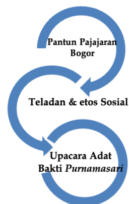
Gambar 1. Konsep Kajian Nilai Keteladanan Sosial

berfungsi untuk menyatukan etos sosial (Sumardjo, 2009). Dari sebuah teladan dan etos sosial yang terdapat di dalam pantun. Pelaksanaan ritual atau upacara merupakan bentuk dari hal tersebut, karena dalam pantun seringkali diungkapkan bagaimana tingkah laku masyarakat Sunda diwakili oleh tokoh-tokoh yang diceritakan dalam pantun melaksanakan kegiatan ritual/upacara Secara lebih jelas digambarkan melalui analisa dibawah ini: