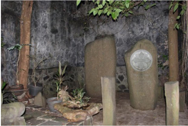
Gambar 4. Kabuyutan Giri Tresna Wangi