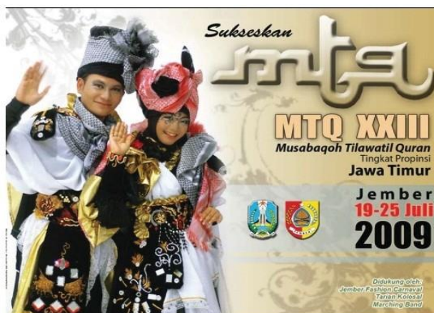
Gambar 2. Baliho MTQ se-Jawa Timur tahun 2009 (Dok. Majalah Halo Jember, 2014)

Selain itu dalam agenda BBJ pada acara MTQ se-Jawa Timur tahun 2009 JFC juga berpartisipasi menampilkan kreasi busana pada baliho/banner yang bernuansa Islam sehingga unsur agama atau kota santri Jember masih dipertahankan sesuai dengan visi misi yang ditargetkan.