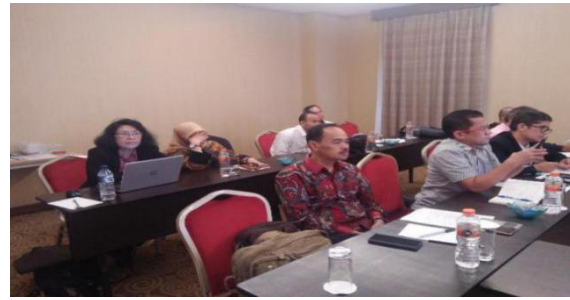
Gambar 1. Pembahasan Tema, Topik, Judul Riset Penugasan Penelitian (KRU-PT)

Kegiatan need assessment dilaksanakan pada saat Sosialisasi Pedoman Penugasan Penelitian (KRU-PT) Bidang