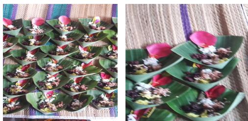
Gambar 1. dan Gambar 2. Struktur Segehan Manca Warna (Dokumen Puspa, 2020)