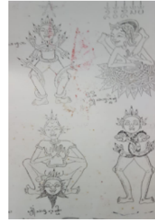
Gambar 6. Tato Jawa dan Tato Bali Kuno

“Sebenarnya tato itu sudah ada sebelum agama, di mesir, peru, himalaya, thailand, dimana-mana ada sejarah tentang tato, terutama di Indonesia tidak hanya di dayak yang tato di pakai sebagai identitas/kasta, di jawa dan dibali kuno juga ada tato tradisionalnya, yang dipakai setiap hari oleh penduduk jawa dan digunakan kehidupan sehari-hari. Contohnya dipakai anti luka/kebal/mudah percaya, menaklukkan binatang. Makanya belanda susah menaklukkan kita di jawa karena kita kebal peluru, makanya kita bisa diadu domba dan lontar tato semuanya dibawa ke belanda dan sekarang dipelajari, lontar tato jawa kuno itu sebenarnya menggunakan bahasa roh di alam, dan prosesnya meditasi, ada bahasa rah, jah mah, kah, dan masih banyak lagi” Ungkap Sutong