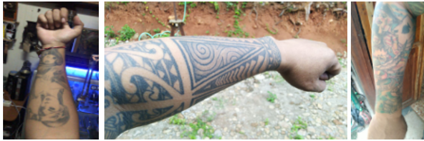
Gambar 3. Tato di tangan Tukul (kiri), di tangan kiri Ale (tengah), dan tangan kanan Ale (kanan)