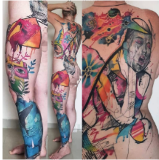
Gambar 5. Sebuah Urban Tattoo, yang memiliki makna tentang ibu pertiwi