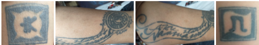
Gambar 4. Kumpulan Motif Tato di Beberapa Bagian Tubuh Kokoh

tra diri yang dimaksud ialah gambaran diri ideal menurut standar individu tersebut. Selain itu motif tato juga akan berkaitan dengan bagaimana individu berpikir dan menilai tentang dirinya sendiri. Hal ini pada akhirnya akan mencapai pada suatu standar yang bersifat emosional tentang penilaian diri yang disebut dengan harga diri.