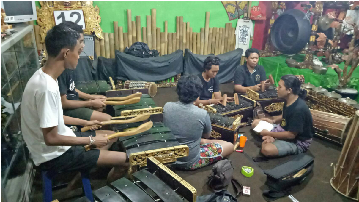
Gambar 1. Latihan Sektoral gamelan Selonding

suaikan dan menyelaraskan diri mengikuti “kemauan” jaman.