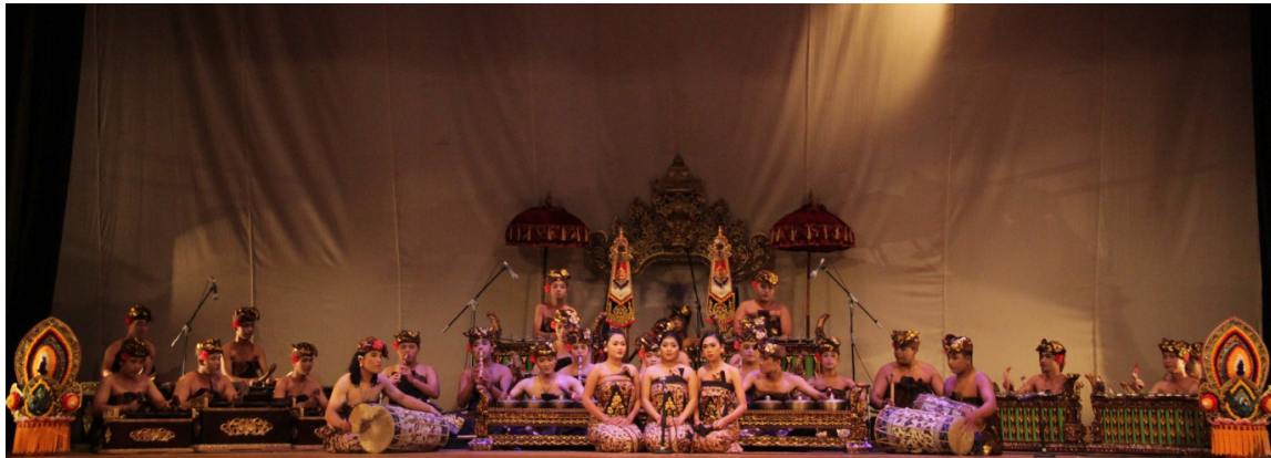
Gambar 4. Pementasan Komposisi Karawitan Patra Dalung