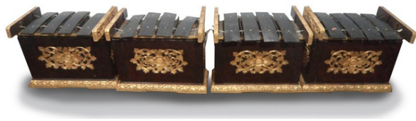
Gambar 3. Petuduh gamelan Selonding