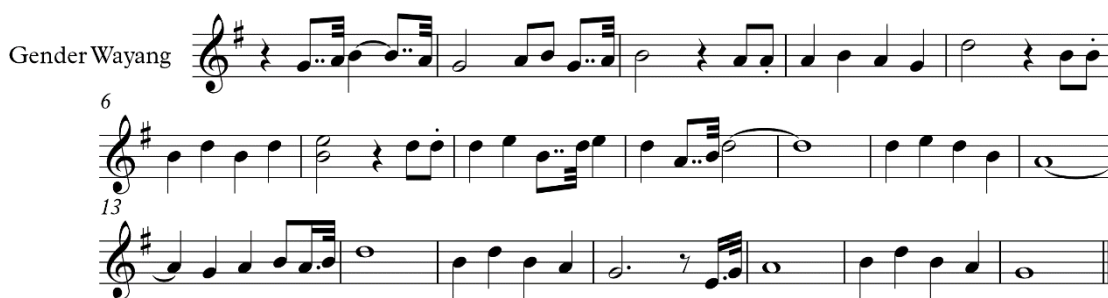
Notasi 3.2.2.1 Melodi yang dimainkan pada instrumen gender wayang .

Dalam instrumen gender wayang , susunan tangga nada pentatonic dapat dilihat pada tabel berikut: