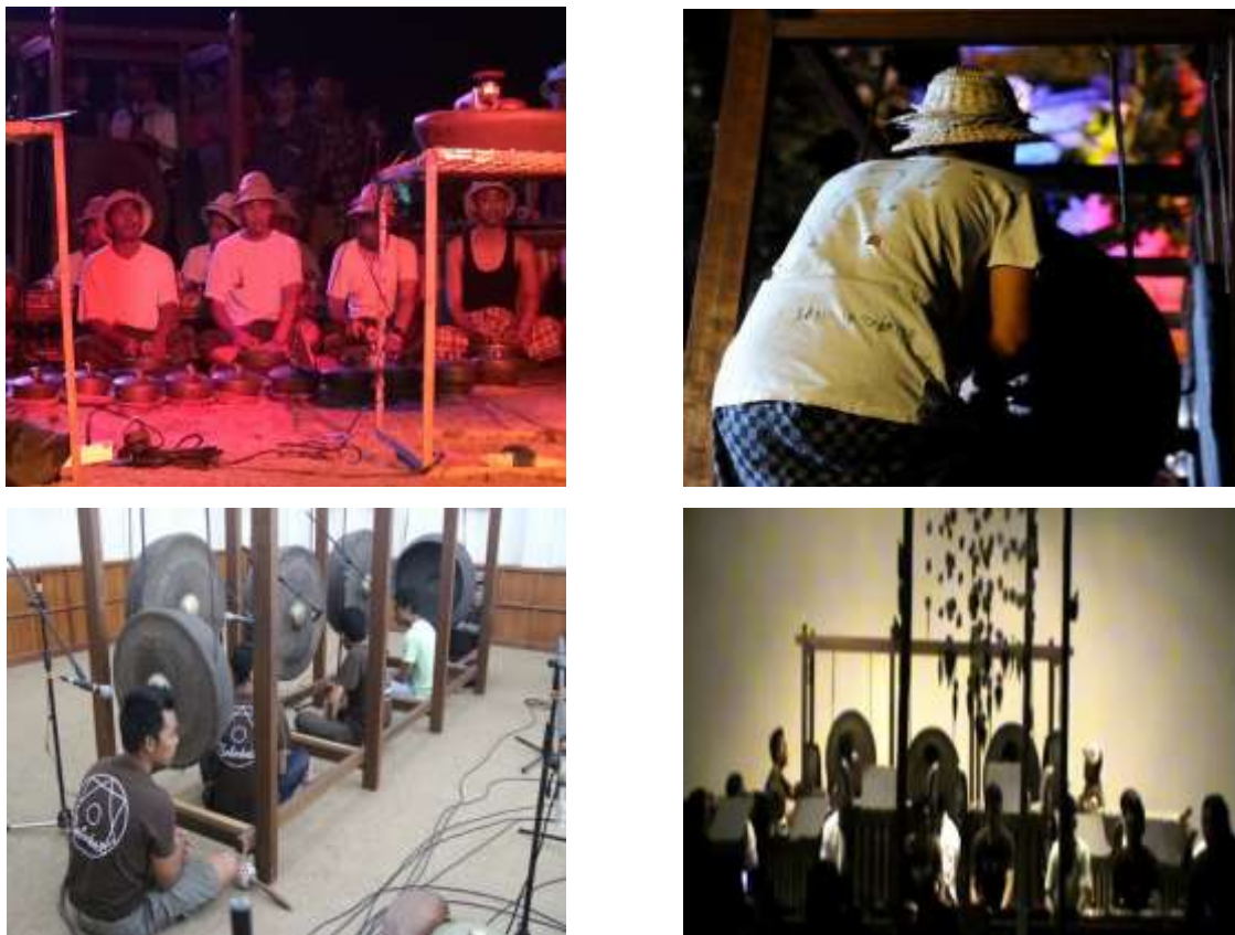
Gambar 1 Pementasan komposisi musik “Kuasa Tanah” Dewa Ketut Alit tahun 2013 dan 2014 dan persiapannya.

Berdasarkan analisis penulis, penabuh yang berjumlah 10 orang dalam karya ini sangat berhubungan dengan pola garap dan jumlah instrumen yang telah ditentukan oleh komponis. Sebagian besar motif-motif pada karya ini merupakan hasil dari subdivisi angka 10 yang telah dirancang oleh komponis. Untuk lebih jelas mengenai cara kerja dan pengorganisiran pola atau motif pada karya ini, penulis akan ulas dalam tahap pembahasan analisis struktur karya yang tercermin berdasarkan notasi karya.