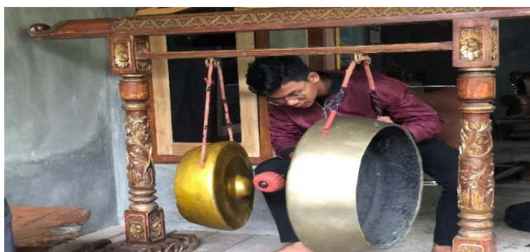
Gambar 2. Instrumen Gung yang berada di Tiyuh Panaragan, pada sebelah kanan pemain disebut Gung Lunik dan sebelah kiri pemain disebut Gung Balak. (Foto: Erizal Barnawi, 11 September 2022).

Gung adalah instrumen berpencon yang ukurannya seperti instrumen kempul dalam Karawitan Jawa. Instrumen Gung dipasang dengan cara digantung pada instrumen Gung yang disebut cagak siger . Ada dua buah instrumen Gung yang digunakan, yaitu Gung Balak (Gong Besar) dan Gung Lunik (Gong Kecil). Gung yang ada di Tiyuh Panaragan ini memiliki diameter 55 cm untuk Gung yang besar dan 40 cm untuk Gung yang kecil. Gung berfungsi sebagai pengatur ritme dari irama melodi Klenong dan sebagai penutup suatu urutan bunyi yang dimainkan dalam suatu tabuhan.