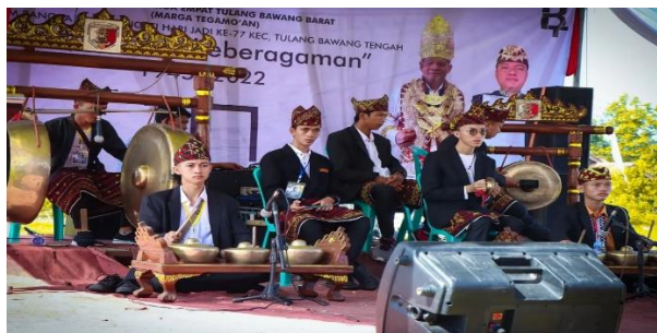
Gambar 9. Kostum Pemain ansambel Klenongan Saat Pentas 2.