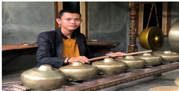
Gambar 1. Instrumen Klenong yang berada di Tiyuh Panaragan (Foto: Erizal Barnawi, 11 September 2022).

Megow Pak disebut Rancangan yang diberi tali untuk tempat dudukan pencon-pencon tersebut. Adapun cara untuk mendapatkan bunyi ialah dengan memukul langsung pada wilayah tabuhan atau kepala pencon tersebut.