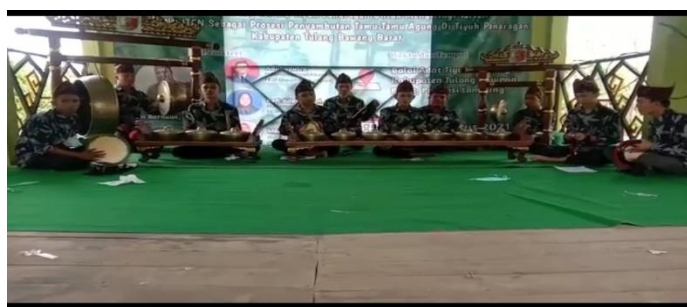
Gambar 6. Tempat Latihan Rutin ansambel Klenongan yang berada di Balai Adat Tiyuh Panaragan. (Dokumentasi forum mulei mengenai panaragan, 2021).

Menurut Kamus Besar Bahasa Indonesia (Kementerian, 2017) kata 'tempat' memiliki beberapa pengertian yakni, 1) sesuatu yang dipakai untuk menaruh, 2) ruang yang tersedia untuk melakukan sesuatu, 3) ruang yang dipakai untuk menaruh, menyimpan, mengumpulkan, dan sebagainya, 4) ruang yang didiami atau ditempati, 5) bagian tertentu dari suatu ruang, 6) sesuatu yang dapat menampung, 7) kedudukan atau keadaan letak sesuatu. Berdasarkan pengertian tersebut, tempat yang dimaksud ialah ruang yang tersedia untuk melakukan sesuatu, yakni dalam hal penyajian ansambel Klenongan bertempat di suatu tempat yakni, Sekretariat Lembaga Masyarakat Adat Tiyuh Panaragan bertempat di Suku 01 Tiyuh Panaragan. Tempat tersebut merupakan tempat latihan sekaligus pementasan dari sajian ansambel Klenongan untuk masyarakat setempat sebagai ajang hiburan dan penyambung silaturahmi.