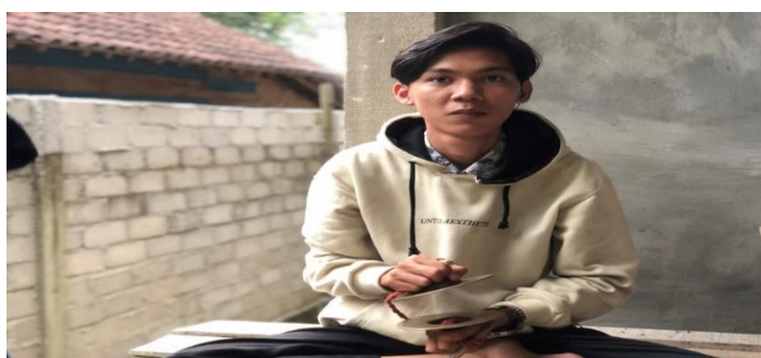
Gambar 3. Instrumen Gujih (Foto: Erizal Barnawi, 11 September 2022).

Gujih adalah suatu instrumen yang bentuknya seperti instrumen ceng-ceng kopyak dalam ansambel Gong Gede Bali, tetapi ukurannya lebih kecil dari instrumen ceng-ceng kopyak . Sumber bunyi yang diperoleh dari instrumen gujih ialah dengan membenturkan kedua belah instrumen gujih yang dipegang dengan tangan kanan dan tangan kiri penabuh. Instrumen gujih yang ada di Tiyuh Panaragan memiliki diameter 16,5 cm. Instrumen gujih ini, terdiri dari dua bagian pipih yang terbagi dari satu tangkep dan fungsi utama dari instrumen gujih adalah sebagai pengikut melodi pokok, serta pola permainannya dalam ansambel Klenong sebagai pemegang ritme.