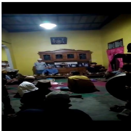
Gambar 7. Pendukung Kegiatan ansambel Klenongan.

menjadi pendukung dalam melaksanakan kegiatan kesenian ini antara lain, kaula muda yakni Muli Menganai dari Tiyuh Panaragan beserta Karang Taruna Palapa Tiyuh Panaragan yang berperan sebagai pemain juga penonton yang ikut serta meramaikan latihan tersebut. Dalam sesi latihan tersebut biasanya dihadiri tokoh adat, aparat pemerintah dan masyarakat.