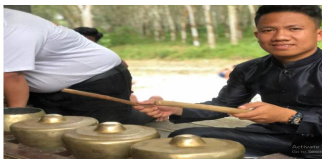
Gambar 5. Instrumen Tabuh/Kelabay. (Foto: Erizal Barnawi, 11 September 2022).

Instrumen Tabuh/Kelabay adalah sebuah instrumen dalam ansambel Klenongan yang tersusun berjajar tiga pencon dengan menggunakan tatakannya. Instrumen ini menyerupai instrumen Kempyang yang ada di Karawitan Jawa. Fungsi dalam instrumen Tabuh/Kelabay yakni memulai dalam setiap tabuhan. Selain itu, instrumen Tabuh/Kelabay sebagai pemberi ritme pukulan dalam tiap-tiap tabuhan yang di sambut atau diikuti langsung oleh instrumen Klenong. Instrumen Tabuh/Kelabay sangat memegang peranan penting karena sebagai pembuka atau yang memulai dalam setiap tabuhan. Bahkan sebagai penentu tempo awal dalam setiap tabuhan karena instrumen tabuh/kelabay ini sebagai instrumen intro dalam pengawal sebuah tabuhan/lagunya.