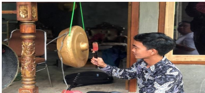
Gambar 4. Instrumen Gender. (Foto: Erizal Barnawi, 11 September 2022).