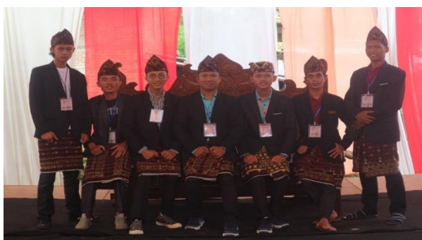
Gambar 8. Kostum Pemain ansambel Klenongan Saat Pentas 1 (Dokumentasi di ambil dari Forum Mulei Menganai Panaragan, 2020).

Pada saat penyajian dan latihan rutin, pemain hanya menggunakan pakaian yang biasa digunakan untuk melakukan aktivitas harian, namun ketika melakukan pementasan, mereka menggunakan seragam rapi dan sopan serta menggunakan Peci Hitam bermotif Tapis, berbagai macam kemeja dengan motif Tapis (motif khas Lampung) atau pun baju beskap/jas, dan celana bahan berwarna hitam yang dibalut dengan kain tumpal (kain khas Lampung). Adapun beberapa kostum yang kerap digunakan saat pementasan sebagai berikut.