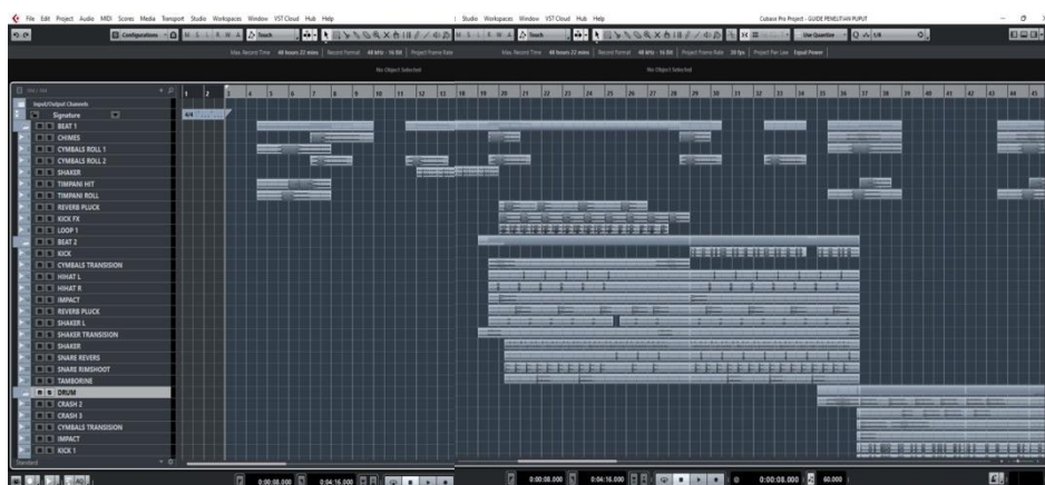
Gambar 1. Tangkapan layar Penyusunan pola untuk instrument drum digital

Instrumen pertama yang direkam untuk ditambahkan dalam musik guide adalah drum yang disusun dari data wav atau sampling virtual instrumen berdasarkan kebutuhan dan keinginan Danurseto selaku produser musik. Penyusunan drum ini menggunakan berbagai sampling dari berbagai soundbank sampling berbayar hingga merekam sendiri instrument drum satu per satu kemudian dimanipulasi data audionya menggunakan teknik pewarnaan frekuensi dengan plugin equalizer pada DAW. Hal ini dilakukan dengan sangat detail dari membuat pola irama untuk bagian verse, chorus, pre chorus, interlude, hingga pengulangan chorus. Penyusunan pola-pola ini dilakukan secara berkesinambungan dengan cara menyusun kompleksitas ritme yang paling renggang untuk verse hingga semakin rapat pada pengulangan chorus yang terakhir. Hal ini sebagai bagian dari teknik menyusun tensi dalam musik yang dibuat oleh Danurseto.