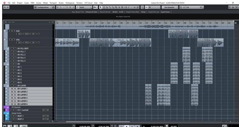
Gambar 2. Tangkapan layar track vokal utama dan track vokal latar

perekaman instrument dianggap selesai oleh Danurseto, maka tahapan selanjutnya adalah perekaman vokal oleh Tyok Satrio.