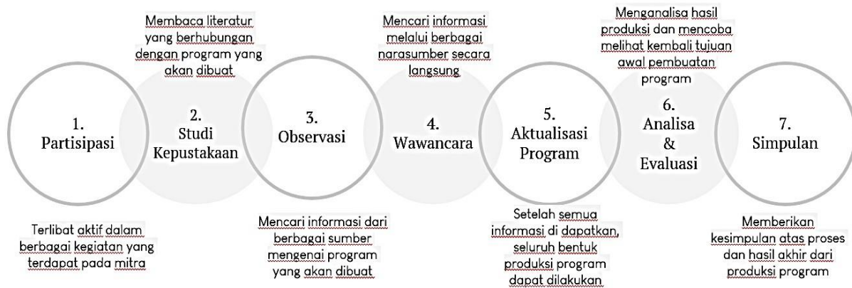
Gambar 1. Bagan Alur Proses Produksi Podcast Bali TV.

Dengan melakukan observasi penulis memiliki dasar informasi mengenai narasumber, yang selanjutnya semua informasi yang didapatkan ini dapat divalidasi dalam proses wawancara narasumber.