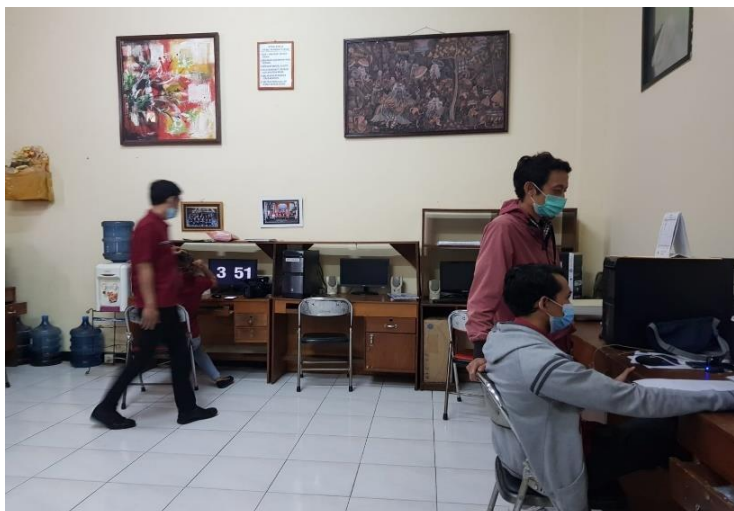
Gambar 5. Ruang Editing Konten Audio dan Video Bali TV.