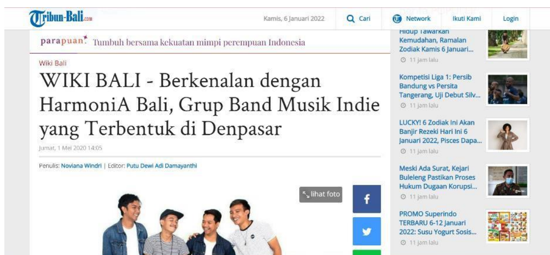
Gambar 2. Profile Narasumber pada Platform Berita Digital "Bali Tribun News".

Setelah melakukan riset (pengumpulan informasi) mengenai narasumber melalui proses observasi dan wawancara, selanjutnya dapat disusun kerangka naskah pertanyaan yang akan digunakan oleh host/mc saat membawakan acara agar tetap sesuai dengan tema utama podcast yang telah ditentukan. Adanya naskah pertanyaan juga membantu mc/host tetap in-line dan tidak melontarkan pertanyaan yang melenceng jauh dari hal – hal yang seharusnya menjadi bahan pertanyaan. Untuk itu, dalam hal ini penulis perlu menyusun kerangka naskah pertanyaan yang disesuaikan dengan pembagian segmen acara.