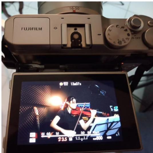
Gambar 6: kamera Fuji Film XA-3