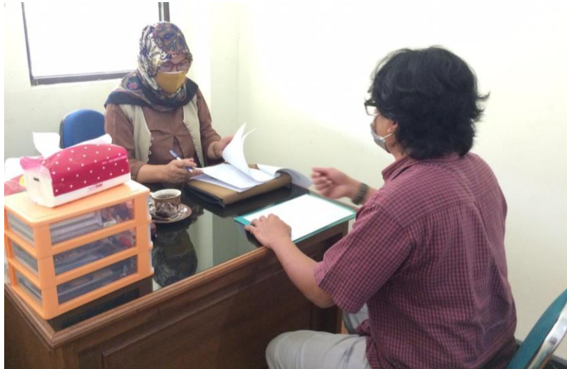
Gambar 1: Konsultasi dengan Kaprodi Pendidikan Musik ISI Yogyakarta

terarah, dengan mengacu pada visi misi Institusi secara kontekstual dimana gagasan dapat diwujudkan sebagai pendukung terwujudnya ISI Yogyakarta sebagai perguruan tinggi seni nasional yang unggul, kreatif, dan inovatif berdasar Pancasila.