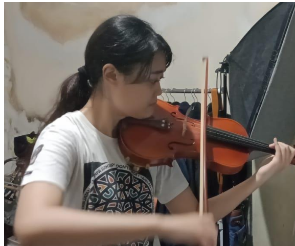
Gambar 3: pengecekan talent Praktik Instrumen Lanjut III (Violin)

Pelaksanaan perekamnan video hasil pembelajaran mata kuliah Praktik Instrumen Violin dilaksanakan di studio melalui beberapa tahapan. Setiap tahapan disusun sebelumnya secara terperinci guna pencapaian hasil yang maksimal. Tahapan tersebut merupakan acuan pelaksanaan perekaman secara sistematis, diantaranya: