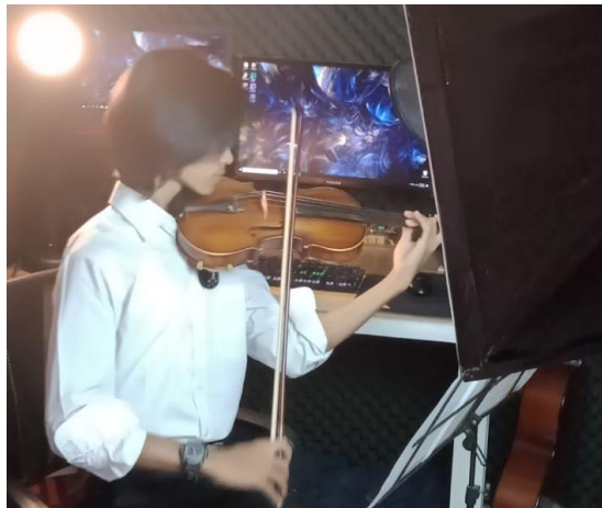
Gambar 4: proses perekaman Praktik Instrumen Menengah I (Violin)