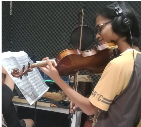
Gambar 2: pengecekan talent Praktik Instrumen Menengah I (Violin)

Pengecekan penampilan dan Latihan terhadap talent dilakukan guna memastikan sebuah pertunjukan yang berdasar orientasi mutu. Mahasiswa terpilih untuk kemudian melakukan pengecekan ulang dan praktik bersama peneliti. Hal tersebut dilakukan berdasar ketentuan kesepemahaman praktik dalam kurun waktu satu semester terakhir. Ketentuan teknis meliputi pemakaian aspek musikal simbol auditori dan interpretasi terkonteks dengan bahan lagu yang dimainkan.