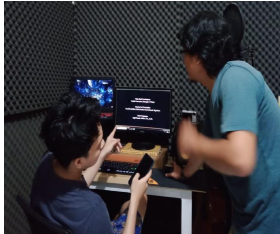
Gambar 9: diskusi konten bersama editor