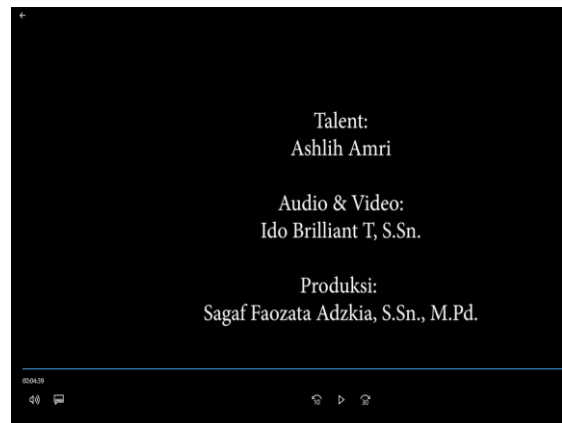
Gambar 11: teks penutup video

Tahapan akhir dalam pembuatan konten video youtube hasil pembelajaran praktik instrumen violin ini adalah evaluasi hasil untuk kemudian pemostingan konten video pada youtube. Evaluasi hasil dilakukan guna memenuhi kualitas standar produksi. Peneliti melihat secara detil hasil akhir video yang telah menjadi konten yang siap posting. Evaluasi dilakukan guna meminimalisir kekurangan-kekurangan yang ada. Jika terdapat kekurangan krusial maka akan kembali ditinjau untuk kemudian dibenahi kembali pada