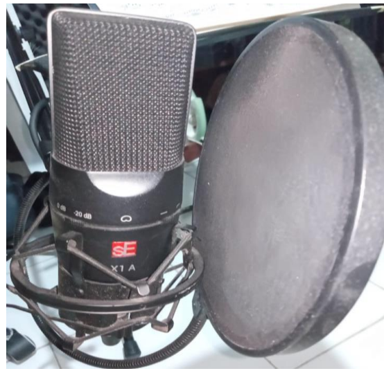
Gambar 7: Microphone SE Electronics X1 A

Pelaksanaan editing dilalui guna menggabungkan hasil akhir rekam audio dan hasil akhir rekam visual. Penggabungan dilakukan dengan teliti agar gerak visual selaras dengan suara yang telah direkam sebelumnya. Editing visual diharuskan memenuhi kriteria estetik melalui filter yang mendukung, dengan pengaturan pencahayaan dan warna yang selaras. Begitupun editing audio melalui tahapan pemenuhan efek ruang akustik yang mencukupi. Efek audio yang diaplikasikan sebagaimana mungkin dapat mewakili kebutuhan karakter permainan lagu klasik violin. Suara yang diharapkan selaras seperti halnya pertunjukan resital secara langsung dalam ruang akustik yang bagus dengan reverb yang mencukupi namun tidak merubah kealamian karakter instrumen violin yang dipakai.