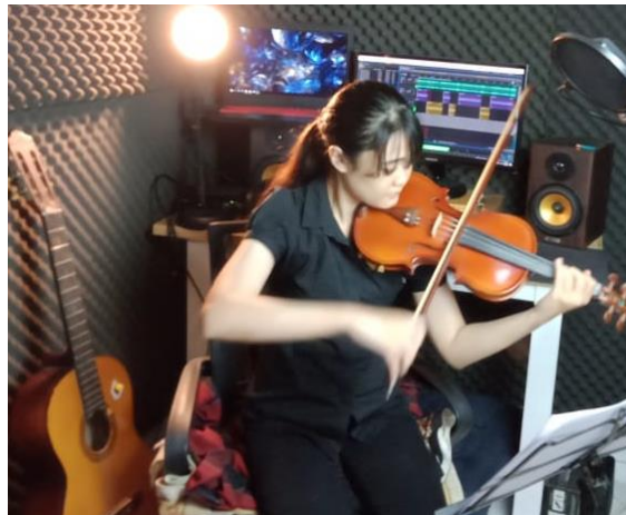
Gambar 5: proses perekaman Praktik Instrumen Lanjut III (Violin)