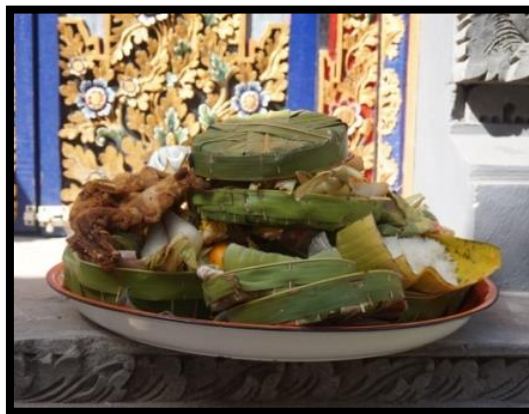
Gambar 8. Banten peras gong di Desa Adat Tejakula

Seperti yang telah dipaparkan pada uraian di atas, Gending Sekatian merupakan salah satu sajian yang menggunakan Gamelan Gong Keyar sebagai media dalam penyajiannya yang terhubung langsung dengan prosesi ritual keagamaan. Oleh sebab itu diperlukan banten (sesajen upacara) sebagai wujud persembahan kepada Tuhan sebelum menabuh gending tersebut. Banten merupakan persembahan suci yang dibuat dengan sarana tertentu yang meliputi air, dupa, bunga, daun-daunan, makanan dan lain sebagainya (Titib, 2003). Sesuai yang telah disebutkan pada latar belakang, bahwa menurut Sukerta (2010) menyatakan sesajen barungan gamelan adalah salah satu hubungan antara seni karawitan dengan upacara. Lebih lanjut dinyatakan sebelum gamelan dipukul (menyajikan suatu gending), terlebih dahulu dipersembahkan satu bentuk sesajen oleh anggota sekaa yang dituakan dihaturkan pada instrumen gong dan diakhiri dengan memukul instrumen gong sebanyak tiga kali. Kemudian baru diperbolehkan memukul gamelan (menyajikan suatu gending).