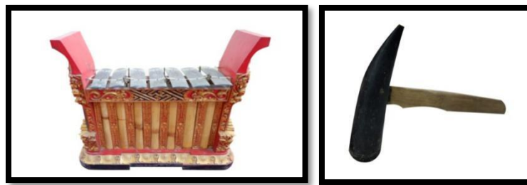
Gambar 2. Instrumen (kiri) dan panggul (kanan) penyacah

Secara musikal, instrumen penyacah sangat dibutuhkan dalam barungan Gamelan Gong Kebyar di Bali Utara, karena membantu dan berfungsi untuk memperpanjang suara dari instrumen pemade. Mengingat dalam barungan Gong Kebyar Buleleng, instrumen ugal/giyung, pemade dan kantil dipasang dengan cara dipacek sehingga suara yang dihasilkan relatif lebih pendek dari instrumen penyacah. Instrumen penyacah yang digunakan dalam sajian Gending Sekatian menggunakan bilah yang berjumlah tujuh dan berfungsi sebagai instrumen bantang gending serta memberikan kejelasan pada kalimat lagu yang disajikan.