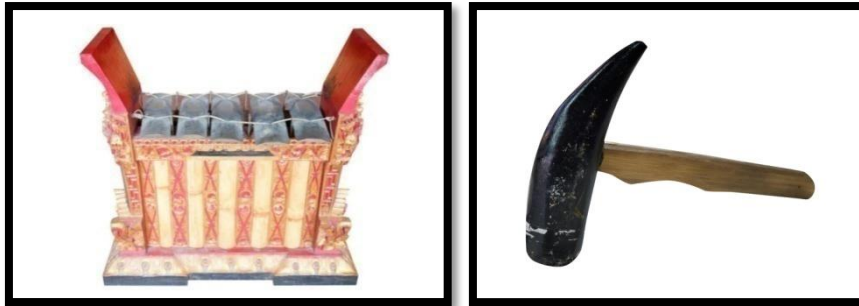
Gambar 3. Instrumen (kiri) dan panggul (kanan) jublag

karet agar kualitas suara yang dihasilkan lebih lunak. Pada sajian Gending Sekatian , instrumen jublag juga digunakan untuk menyajikan pola tabuhan utuh atau tidak dikembangkan serta mempertegas melodi dengan sistem pukulan dua kali setelah pukulan penyacah.