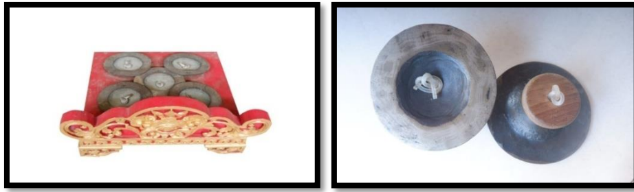
Gambar 6. Instrumen (kiri) dan penekap (kanan) cèng-cèng kècèk