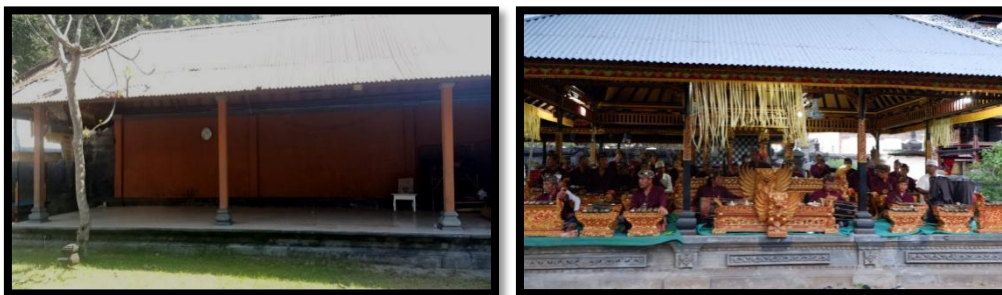
Gambar 7. Bale gong Pura Maksan (kiri) dan Pura Puseh (kanan)

Masyarakat di Desa Adat Tejakula saat melaksanakan upacara piodalan di Pura Maksan Tejakula menyajikan Gending Sekatian pada sebuah bangunan yang berbentuk memanjang atau yang sering disebut sebagai bale gong yang letaknya berada dibagian jeroan Pura. Mengingat kehadiran sajian Gending Sekatian oleh masyarakat setempat dianggap sangat penting dalam mengiringi prosesi ritual keagamaan. Begitu juga ketika masyarakat melaksanakan upacara piodalan di Pura kahyangan tiga, Gending Sekatian pun disajikan pada bale gong . Akan tetapi di area Pura Kahyangan Tiga seperti misalkan Pura Puseh terdapat dua bale gong yaitu bale gong ageng dan bale gong alit yang letaknya dibagian jeroan pura bersamaan dengan bangunan utama yang disucikan oleh masyarakat. Ketika masyarakat melaksanakan upacara keagamaan di pura tersebut, digunakan gamelan Gong Gede yang memiliki jumlah instrumen cukup banyak sehingga sajian Gending Sekatian diletakkan pada bale gong ageng .