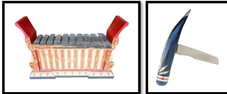
Gambar 1. Instrumen dan panggul ugal/giying

di Desa Adat Tejakula Kabupaten Buleleng diantaranya, yaitu instrumen ugal/giying, instrumen Trompong, instrumen kendang cedugan , dan instrumen kajar.