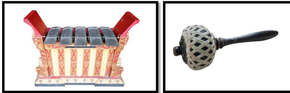
Gambar 5. Instrumen (kiri) dan panggul (kanan) jègogan

suatu kalimat gending. Kata pesu-mulih tersebut terdiri dari dua kata, yaitu pesu dan mulih . Pesu dalam bahasa Bali memiliki arti keluar sedangkan mulih berarti pulang (Sukerta, 2009). Instrumen pesu-mulih yang digunakan pada sajian Gending Sekatian di Desa Adat Tejakula terdiri dari beberapa jenis instrumen yang dapat dijelaskan secara rinci diantaranya, yaitu jegogan, kempul, kempli dan gong.